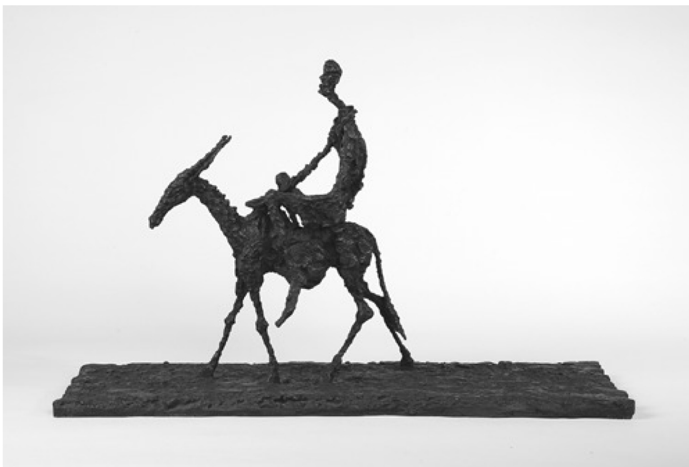
淀井敏夫作「古い道A」(1967)／ブロンズ／39.5×64.5×21.5