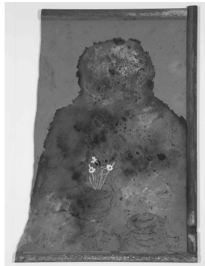
椿野浩二 作「黙 水仙」

終了後20年を迎えてもなお、但馬の芸術活動を牽引し続けるドッキングアートメンバーに敬意を表し、彼らの活動を紹介します。また、40歳未満の若手作家を、これからの但馬の芸術活動を支えていく「+NEWメンバー」として紹介いたします。