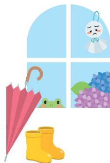
体調が悪いときは外出を控えよう