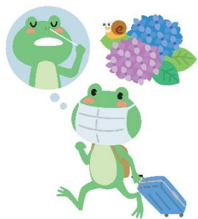
旅行や会食前後は積極的に検査をしよう