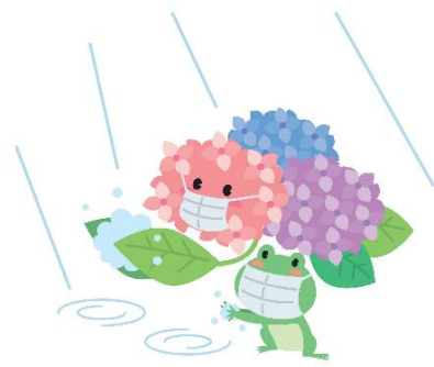
きちんと手洗い・手指消毒をしよう