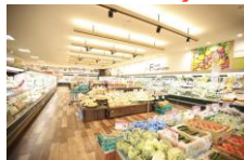
明るく清潔な職場