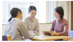
様々な職種がチームで働く