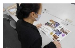
お気持ちに丁寧に寄り添います