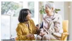
幅広い年代の職員が活躍中