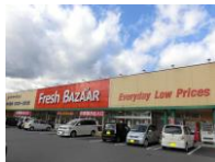
勤務店舗はご相談ください！

仕事内容：①生鮮食品部門(商品補充・盛付・加工) ②グロサリー部門(商品補充・売場整理) ③レジ部門