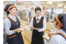
女性従業員が多く アットホーム♪