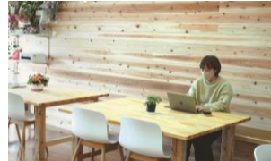
コワーキングスペースと共用した職場入口