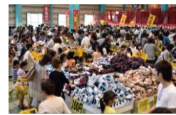
毎年恒例の「靴祭り」★