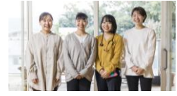
アットホームな職場です！