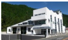
JR生野駅から徒歩3分♪