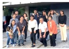
少人数でアットホーム