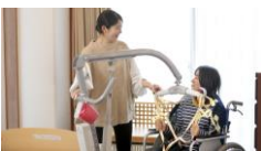
持ち上げない介護を実施