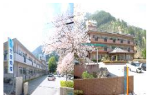
大植病院とあさご長寿苑

仕事内容：① 看護師・准看護師 (要資格) ② 病棟業務/看護助手 ③ 老健施設内業務/介護員 作業療法士・精神保健福祉士