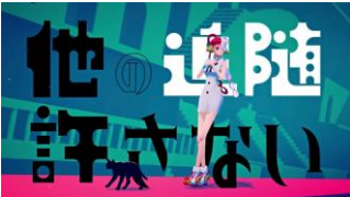
2 当社のフォント使用例(Adoウタカタラライ)

仕事内容： 著名なデザイナーがデザインするフォントやデジタルコンテンツ制作のお手伝い