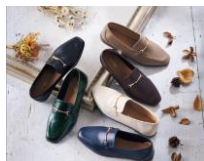
こんな商品を扱っています♪