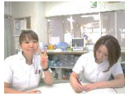
同世代ママ職員も多数♪