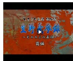
生野義拳 DVD (しそうの逸話)