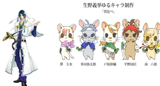
▲現代風のキャラクターによるPR (生野観光協会事業)