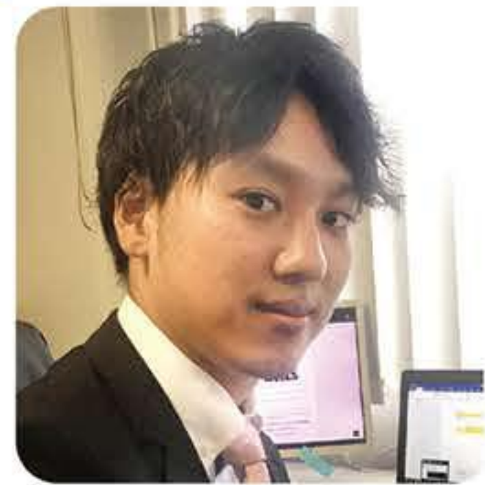
●入社年数/1年 ●所属部署/経営管理部 総務人事課

当社は、環境対応自動車のリチウムイオン電池部品において世界でも大きなシェアを獲得しています。海外にも製造拠点を持つなど、但馬からでもグローバルに活躍できる環境が整っています。その為の教育体制も充実しているので心配はいりません。わたしたち若手社員も、良き先輩としてしっかりとサポートします。是非一緒に、頑張っていきましょう!!