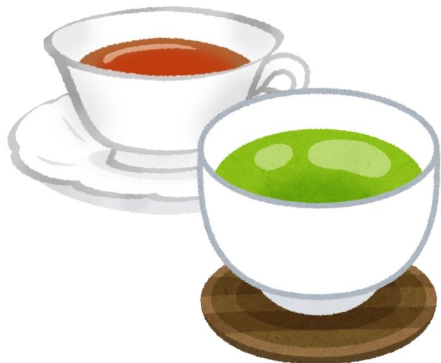
3年次 国際関係学 カフェ