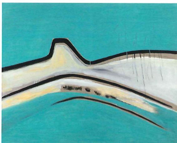
「色彩・時間・再生」2025年/油彩、アクリル、カンヴァス H131.0×W163.0cm