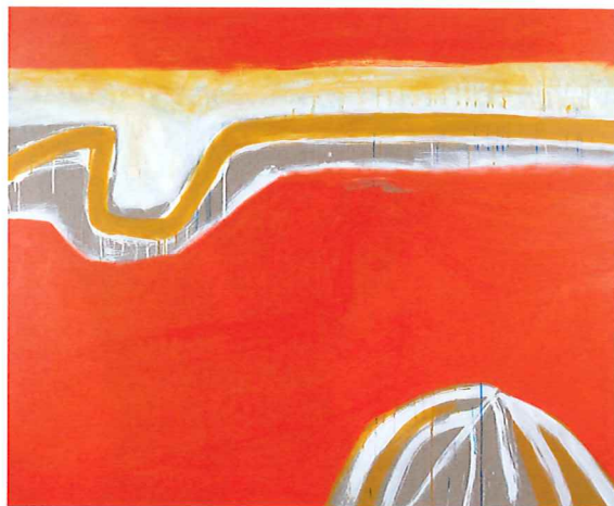
「色彩・時間 2021-1」2021年/油彩、アクリル、カンヴァス H150.0×W185.0cm