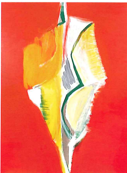
「芯・時間・色彩 II-3」2023年/油彩、アクリル、カンヴァス H130.3×W97.0cm