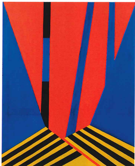
「なつめやし樹」1975年/油彩、カンヴァス H163.0×W131.0cm