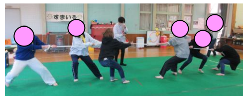
ママ向け運動会の様子