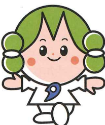
【朝来市】 ちやすりん