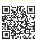
【携帯電話】 ※2 ※3 ※4

NAVITIME ※1 ナビタイムジャパン ☎03-3402-0823 [受付] 10~18時 ※土日祝及び社指定休日を除く