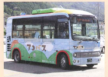
朝来市 アコバス 市長公室総合政策課 ☎079-672-3301