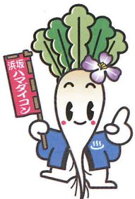
【新温泉町】 ハマちゃん