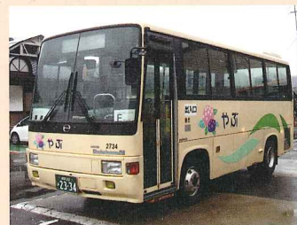
養父市 養父市コミュニティバス 企画総務部企画政策課 ☎079-662-7602