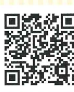
【携帯電話】 ※2 ※4