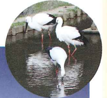
④ コウノトリ文化館