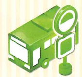
バスNAVITIME ※2 【Android】