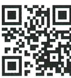
NAVITIME ※2 ※4 【携帯電話】