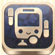
【iPhone】 ※2 ※3