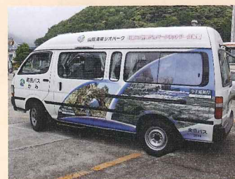
香美町 香美町民バス 企画課 ☎0796-36-1962