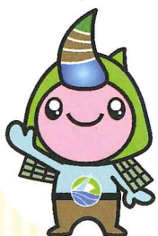
【香美町】 ジオンくん