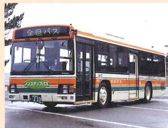
全但バス 営業部乗合事業課 ☎079-662-2133