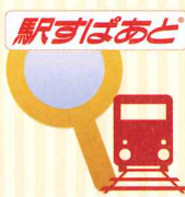
【Android】 ※2 ※3