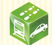
NAVITIME ※2 ※4 【iPhone・Android】

NAVITIME ※1 ナビタイムジャパン ☎03-3402-0823 [受付] 10~18時 ※土日祝及び社指定休日を除く