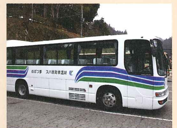
新温泉町 夢つばめ 企画課 ☎0796-82-5624