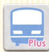
【Android】 ※2 ※4