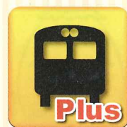
【iPhone】 ※2 ※4