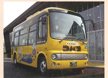
豊岡市 コバス, イナカー 都市整備部都市整備課 ☎0796-23-1712