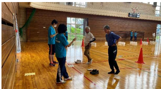
【 ボッチャ体験会の様子 】