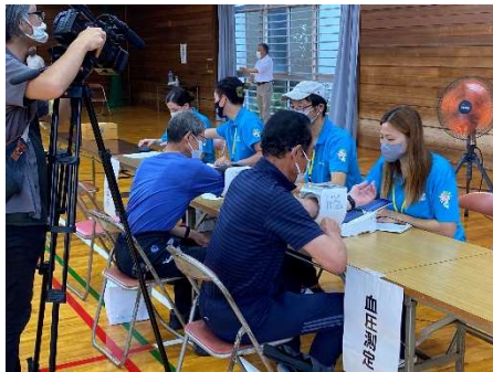
【 測定会の様子 】

また、測定結果の集計時間を活用しボッチャの体験会を行いました。地域の方々との交流も図れ、和気あいあいとした雰囲気皆さんボッチャを楽しまれました。