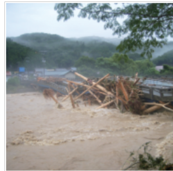
1. 朝来市開庁式 2. 朝来市議会開会 3. 初代市長に井上 英俊氏 4. カナダ・パース町と姉妹都市提携協定を締結 5. 2代市長に多次 勝昭氏 6. 台風9号の豪雨災害