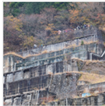
1. 記録的な大雪 2. 「めざせ、日本遺産！銀の馬車道・鉦石の道」フォーラムを開催 3. 山城の郷改修工事完成 4. 「播但貫く、銀の馬車道 鉦石の道」が日本遺産に認定 5. 多次市政3期目スタート 6. 法隆寺ゆかりの都市文化交流協定を奈良県斑鳩町などと締結 7. 「ASAGOiNG Garden KOUBA」オープン 8. 神子畑選鉦場跡の内部を特別公開