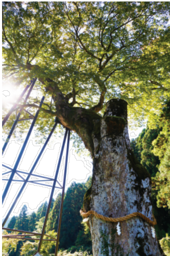
朝来市の木 「けやき」

働く苦勞よろこびにして 流す汗には夢がある 命きらめく この理想郷 暮らしに活気 満ち満ちて 若い力も伸びて行く われら朝来市 大きな未来