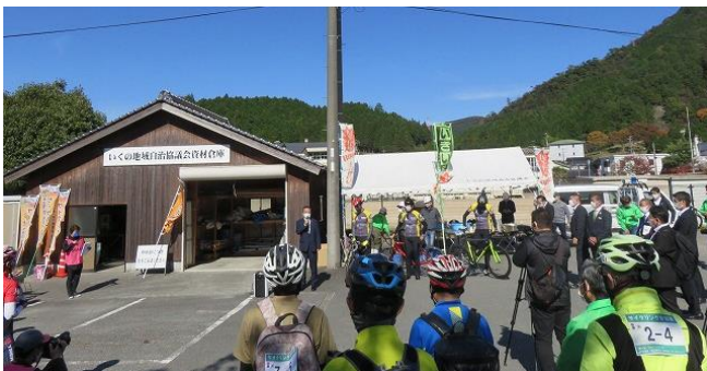
メインホール前での出発式の様子

令和3年10月30日、第4回目となる日本遺産「銀の馬車道」サイクルトレインが開催され、スタッフを含めた65名が秋晴れの馬車道を自転車車で疾走しました。姫路港を出発し、JR播但線の香呂駅で特別列車に乗車。生野駅まで自転車とともに移動。生野メインホール前で再出発を行い、姫路城までサイクリングするコースでした。メインホール前では、いくの地域自治協議会の協賛でハツパ菓子の製作実演を披露するなど、サイクルトレインイベントを盛り上げました。