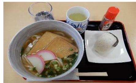
うどん¥300・おにぎり¥80

毎週第3水曜日は紅茶のケーキセットが食べられます。生野紅茶を使用したフワフワでしっとりとした食感のシフォンケーキは喫茶『だんらん』でしか食べられない一品です。是非、足を運んでみてください。