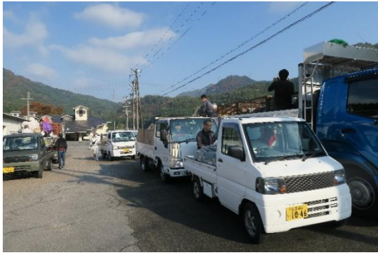
業者車両に積み込む作業

「花づくり・環境美化・ごみ問題対策・空き家・空き地対策」をテーマに活動している さわやか部会 です。