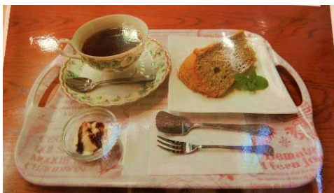
紅茶のケーキセット ¥400