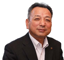
藤岡市長が毎月、 市政運営を解説します！

市は今後も、この取り組みが地域の子どもから大人まで、幅広い世代に広がることをめざし事業に取り組んでいきます。