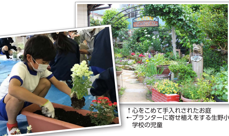
↑心をこめて手入れされたお庭 ←プランターに寄せ植えをする生野小学校の児童