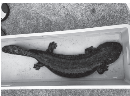
↑レスキューされたオオサンショウウオ