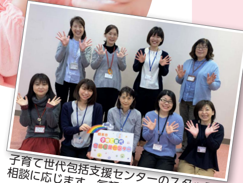
子育て世代包括支援センターのスタッフが相談に応じます。気軽にご相談ください。