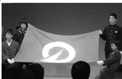
▲将来を担う子どもたちによって町旗を降納。会場は一抹のさみしさに包まれました

最後は、会場全員で「いい日旅立ち」を歌い、朝来市としての新しい郷土の発展を誓いました。