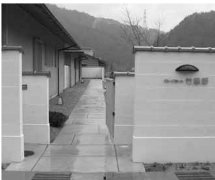
門から玄関へ続くアプローチ

入居者の方が安心して暮らしていただけのことを最優先に、随所に細やかな配慮がされています。また、施設の運営は、いくの喜楽苑の介護経験豊かなスタッフが、入居者の『自立支援』を第一に、必要な手助けを行っています。