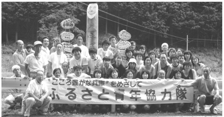
協力隊と中田路地区のみなさん