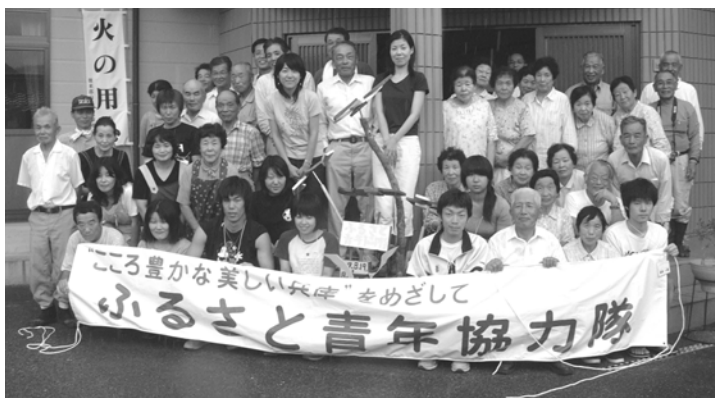
協力隊と立脇地区のみなさん

ふるさと青年協力隊が、8月19日(金)から21日(日)まで朝来市を訪れ、活動しました。今年度の協力隊は、阪神間に在住の青年20名がさのう高原での草刈や植樹、立脇地区と中田路地区での班別作業を行い、地区の皆さんと交流を深めました。