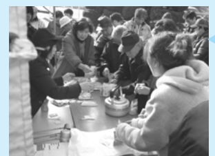
アルファ化米炊き出し