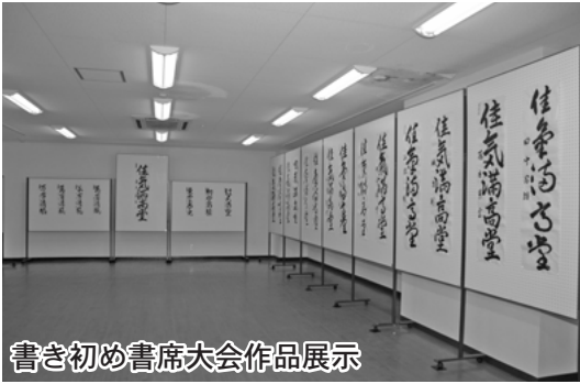
書き初め書席大会作品展示