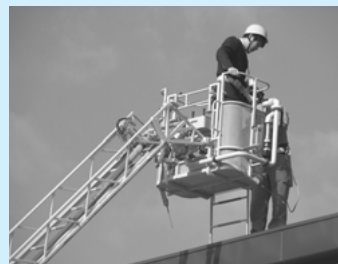
はしご車を使用しての高所救出