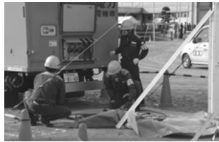
病院への電力復旧