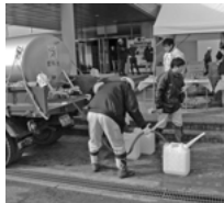
給水車による給水