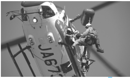
ヘリによる負傷者搬送