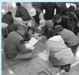
避難所開設・運営 (家族票を記入・仮設トイレ設置等)