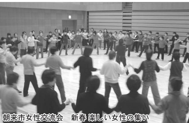
朝来市女性交流会 新春 楽しい女性の集い

また、第1部と第2部の間には、新春交流会を開催し、お茶を飲みながら交流を深めました。