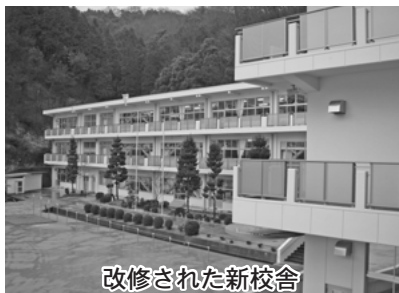
改修された新校舎

八月末に、校舎の地震補強・大規模改修工事が終了し、十一月下旬に増築部分も完成しました。枚田小学校は、木の香りの漂う温かく優しい学校に生まれ変わりました。こどもたちは二期より、新しい気持ちで学校生活を送っています。掃除も今まで以上に丁寧に行い、大切に使うように心がけています。