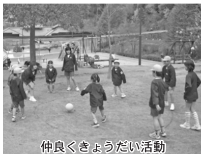
仲良くきょうだい活動