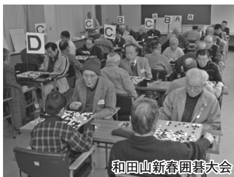
和田山新春囲碁大会

高機能消防指令センター運用開始 2月20日(火)から市消防本部の高機能消防指令センターの運用が開始されました。この指令センターは旧指令センターの老朽化に伴い、昨年6月から約1億5千万円をかけて整備してきました。 但馬初となる発信地表示装置を備え、119番通報の発信場所の地図を瞬時にモニター表示できるほか、障害者、独居高齢者等の災害弱者、ガソリンスタンドなどの危険物施設の所在地などのデータが入力されており、同時に表示することで災害時の即応が可能になります。 また、これまで1階にあったセンターを3階に移し、屋上に自家発電装置を備えることで水害時にも対応できるように