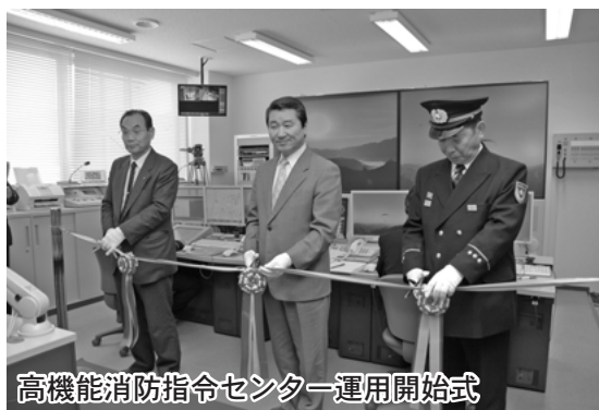
高機能消防指令センター運用開始式

参加者は段に応じてA級からD級までの4つのクラスに別れ、対戦相手と真剣な表情で向き合い一手一手、先の展開を読みながら石を並べ、世代を超えた対局を楽しみました。(結果は下記のとおり)