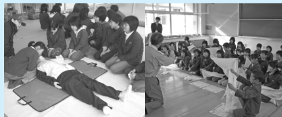
応急手当の方法や心肺蘇生法を学ぶ