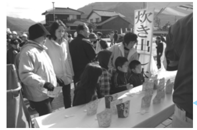
アルファ化米の炊き出し