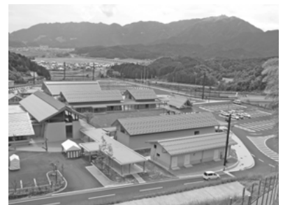
道の駅「但馬のまほろば」

道の駅「但馬のまほろば」は古代の政庁や集落をイメージした施設配置やデザインが、周囲の山並みと調和して、良好な景観を形成していると共に、県産木材・土壁等の自然素材を多く用いており、土採り場跡の緑化とあわせ、全体的に環境共生に取り組んでいるとの評価を受け、今回の受賞となりました。