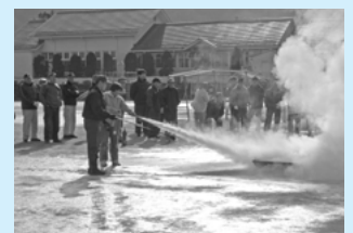
消火器を使用しての初期消火