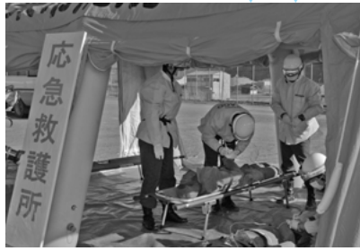
応急救護所設置・けがの程度によって治療の優先順位を判断するトリアージ