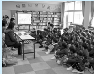
阪神淡路大震災を経験された方から震災の体験談を聞く