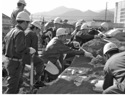
埋没車両からの負傷者救出・搬送