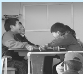
起震車で大地震を体験