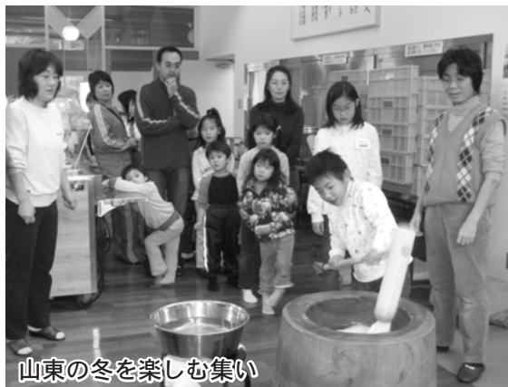
山東の冬を楽しむ集い

山東の冬を楽しむむつどい 1月27日(土)～28日(日)、西宮市立山東自然の家で「山東の冬を楽しむむつどい」が開催され、西宮市から39人の親子が参加しました。 この集いは、都会では体験できない山東の豊かな自然に触れて、大人も子どもも一緒に楽しく体験をしてもらおうと毎年、夏と冬に開催しています。 自然の家周辺では、例年この時期には雪が積もり、参加者はそりすべりなどを体験しますが、今年の冬は雪のまったく無い集いとなりました。参加者は雪が無く少し残念そうでしたが、竹を使った工作に取り組み、もちつきや自然散策を楽しみ、帰りにはよふど温泉につかるなど、山東の自然を思い切り満喫しました。