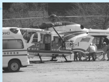
負傷者搬送(ヘリ→救急車)