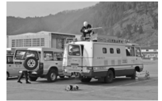
災害緊急電話の設置