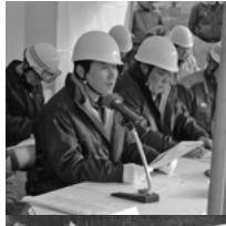
災害対策本部を設置