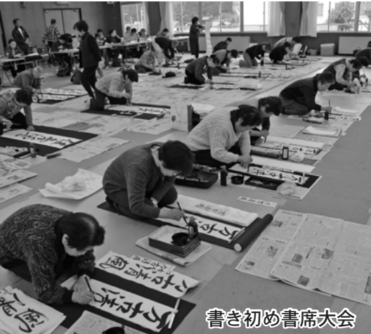
書き初め書席大会