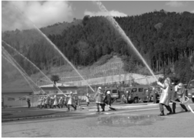
消防団による一斉放水