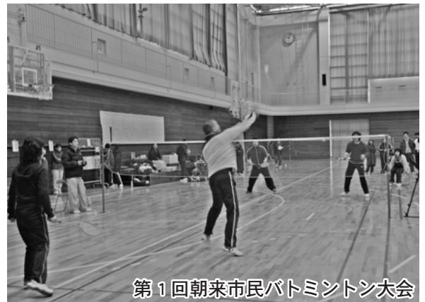
第1回朝来市民バドミントン大会