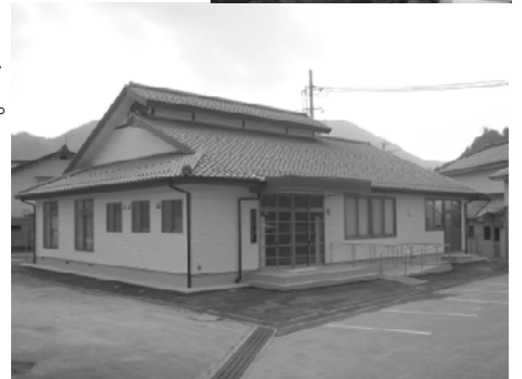
▲与布土地区コミュニティセンター