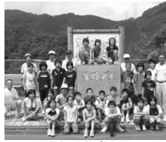
あさごわんぱく教室

山の教室は昭和55年6月より現在まで27年間、子どもたちに豊かな自然体験をさせることによって、たくましい心と身体を育成することをねらいとして、毎月1回小学校4年生から6年生を対象として活動されています。