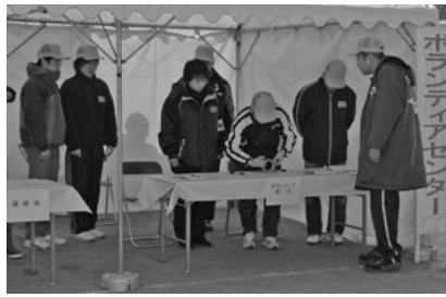
ボランティアセンターの立ち上げ