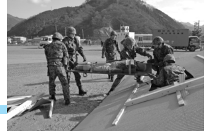
倒壊家屋からの負傷者救出・搬送