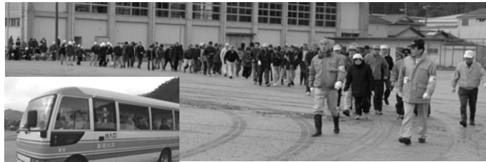
徒歩やバスを使用しての避難