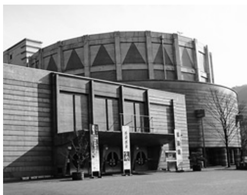
クラシック音楽の普及など地域の芸術振興に貢献してきた和田山ジュピターホール

同ホールは平成4年に開館。朝来市少年少女オーケストラの活動拠点としてクラシック音楽の普及に努めているほか、「アウトリーチ」と呼ばれる出張演奏会