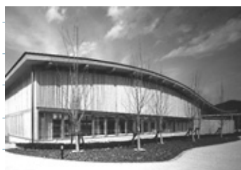
優良木材施設表彰であさご温水プールくじらが農林水産大臣賞受賞(7月)。3月には「県産木材需要拡大優良事例コンクール」最優秀賞も受賞しました。