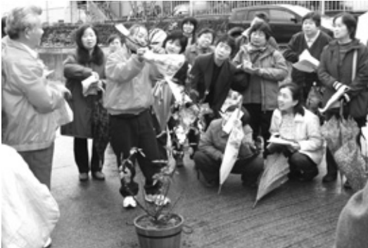
での栽培に役立てようと熱心にメモを取る当選者

まちづくりグループ「さんさん会」は12月9日、和田山駅前のわかば作業所でアンネのバラの苗木を抽選で選ばれた58人にプレゼントしました。