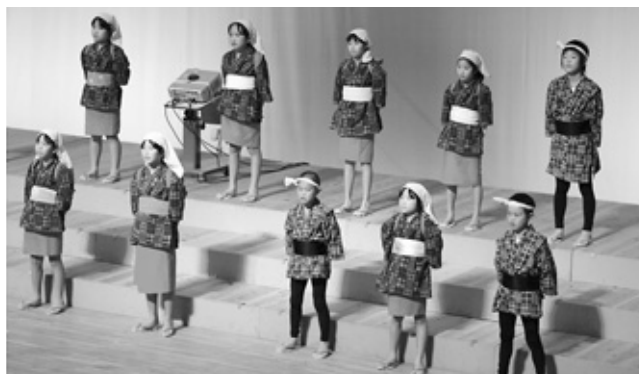
「石刀節」のほか「生野町音頭」も歌いました。

この催しは、市内の小・中学生が一堂に会し、日頃の音楽活動の成果を発表しながら交流を図る行事で、今年が2回目。今回は11の団体が出場しました。中でも、奥銀谷小学校の児童15人は、銀山開坑1200年にちなみ「生野銀山石刀節」などを披露。江戸時代の作業着姿で石刀節を歌い上げると、会場から大きな拍手が送られました。