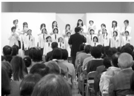
美しい歌声を披露する兵庫稲美少年少女合唱団

焼きそばやから揚げ、新鮮野菜やつきたてのもちの販売や歌謡ショーなど、多彩な催しが行われた中でも、特に好評だったのは、無料で振る舞われた「猪汁」と「ぜんざい」。それぞれ1千食が用意され、温泉を訪れた多くの人は、地元産の農産物がたっぷり入った猪汁やぜんざいに舌鼓を打っていました。