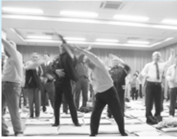
9月に完成したあさGO!!体操を披露。会場の皆さんもそろって「あさ、あさ、ゴー、ゴー」。