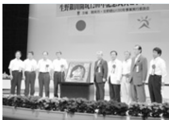
生野銀山開抗1200年記念式典(8月)。1年を通して「生野夏物語」など、さまざまなイベントが開催されました。

1月 ◆賀詞交歓会(4日)◆成人式(7日)◆アコバス運行開始(7日)◆地域防災訓練「1.17は忘れない」(20日)◆曲り尾橋(市道和田山筒江線)完成(27日)