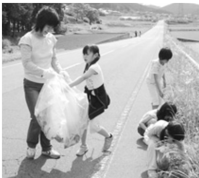
毎年5月下旬～6月上旬に実施される「クリーン作戦」。皆さんとともにきれいな朝来市をつくっていきます。