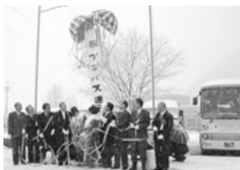
アコバス運行式(1月)。運行開始から1年が経ちました。

今月号の広報では、昨年1年間の市内の行事や出来事、話題など主なものを、1月から振り返ってみます。