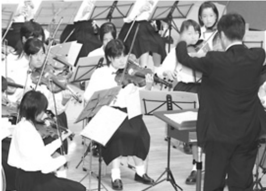
練習の成果を発揮し、みごとな演奏を披露しました。