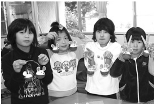
「置物にして1年の幸せを祈ります」。干支にちなんだねずみサンタが完成しました。