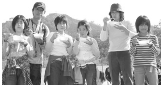
ウォーキングの後、但馬たらふく鍋を食べる参加者

朝来市子ども会は11月11日、今年で3回目となる「ふれあいウォーク大会」を開催しました。 約百40人の参加者は竹田小学校をスタートし、途中6か所に設置されたチェックポイントで竹田城跡や竹田の町にちなんだクイズに答えながらゴールを目指しました。ゴール地点の山城の郷では、和田山町たらふく鍋実行委員会の皆さんが「但馬たらふく鍋」を振る舞い、ゴールした参加者らは温かくておいしい鍋を味わっていました。