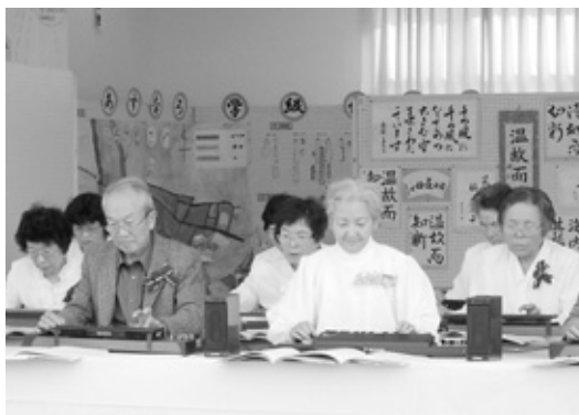
大正琴講座の発表

あさごふれあい人権フェスティバルが11月10日と11日の両日、朝来福祉会館で開催されました。