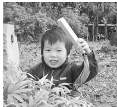
草の中を探すと…「銀塊見つけた！！」

同青年部の創部40周年と生野銀山開坑1200年を記念して行われたこのイベントには市内外から約2百50人が参加。「生野銀山から銀の延べ棒が盗まれた」との設定で地区内の12か所の関所（チェックポイント）を巡り、生野にまつわる3択クイズに挑戦したり、周辺に隠された延べ棒のレプリカを探したり