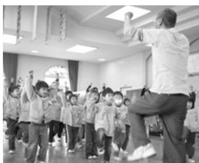
「元気と笑顔の出る体操」あさGO!!体操を楽しみながら習う山口幼稚園園児。まちづくり出前講座のメニューにもあります。

あさGO!!体操のほかにいきいき体操がありますか、この二つの体操はそれぞれどういう位置づけなのでしょう。