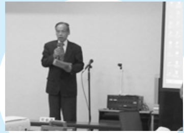
地元地区の区長さん等に司会をお願いして懇談会を開会。