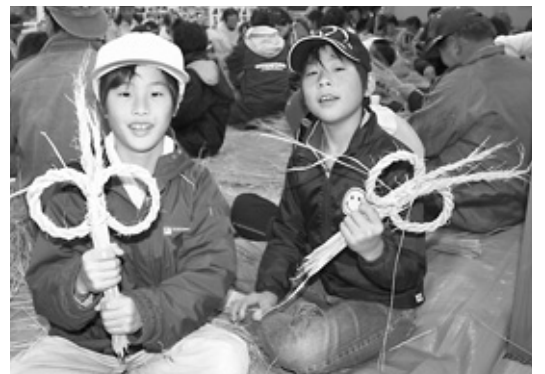
初めての挑戦ながら見事なしめ縄が完成しました。

子どもたちは、できたてのおもちやなべに舌鼓を打った後、しめ縄作りに挑戦。作り方の説明を聞いた後、それぞれにわらを持って作業開始。一本一本丁寧にたばね、しめあげる作業に