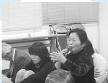
説明の後、参加者からは質問が