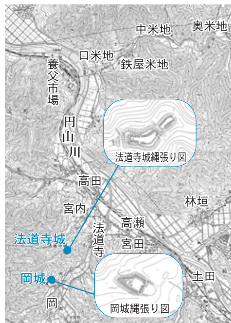
岡城と法道寺城の位置

岡城の縄張りで特徴的なのは、三段の曲輪を高い土塁で囲んでいることです。最上段の曲輪は土塁を利用しており、「櫓台」となっています。但馬で一般的に見られる城郭構造では土塁を持たないのですが、この岡城は但馬の中では特異な構造をしているといえるでしょう。この岡城に見られる土塁囲みの城に類似する城郭として、