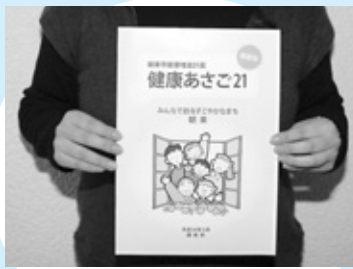
健康課からは「健康づくり」について資料を用いて説明。