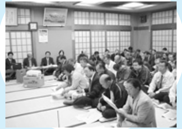
市からの説明を聞く参加者

まずは「環境問題」についてビデオを上映。地球の温暖化等について再認識。その後、「私たちにできること」、「ごみの分別」等について説明。