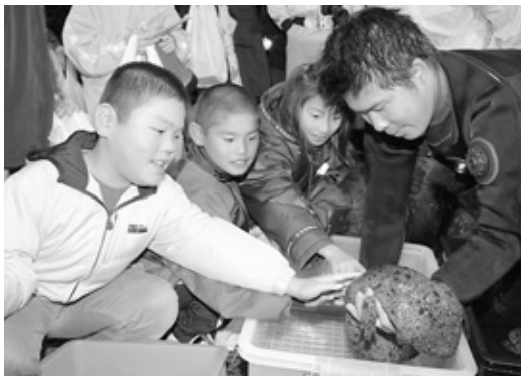
オオサンショウウオを恐る恐る触る子どもたち

世界最大の両生類の感触は、いかに？ 県八鹿土木事務所は11月16日、生野町小野の市川で、国の特別天然記念物オオサンショウウオの観察会を開催しました。 県は護岸改修工事の着手に先立って、オオサンショウウオの捕獲調査と一時保護を行いました。その一環として工事の概要やオオサンショウウオの生態について理解を深めてもらうと開いたもので、地元の小生ら約40人が参加しました。 世界最大の両生類を間近で見ると「大きくてびっくり。触ってみるとぬるぬるしてた」と、自然豊かな市川に小学生らの声が響いていました。