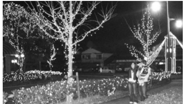
イルミネーションに見入る親子連れ。(生野町口銀谷)点灯期間は1月4日までの17時から22時まで。

電飾約2千個を使った特大のクリスマスツリーが人々の目を引きました。(和田山町駅前)