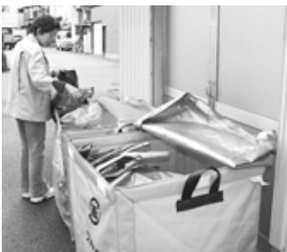
10月から始まった紙製容器包装とプラスチック製容器包装の分別。市民の皆さんの積極的な取り組みにより、ごみは減っているように見えます(次ページ表参照)。

市では、地域が各種環境整備を行うときに利用していただいている、地域づくり支援事業があります。この中には「回収ボックスの防風水等のためのごみステーションの整備」というようなメニューはありますが、今後は要望に応じて対応していきたいと考えています。