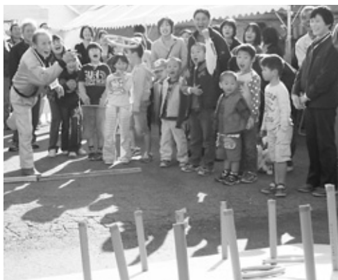
優勝目指して一投

枚田岡会館文化祭実行委員会は11月17日と18日の両日、同会館で第31回文化祭を行いました。