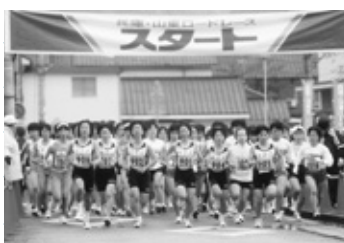
第26回兵庫・山東ロードレース大会・さよなら大会開催(3月)。この大会を最後に26年の歴史に幕が降りました。