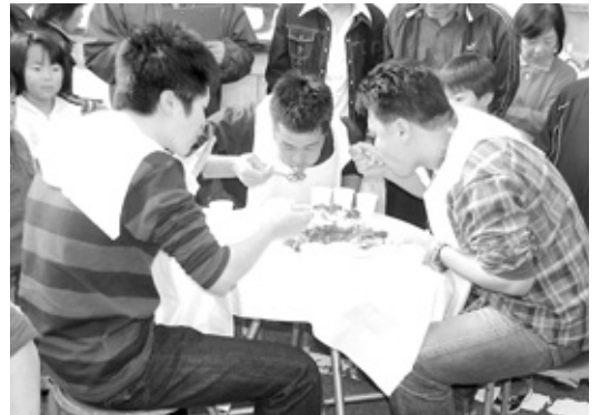
あと一息！つめこめ～

生野もりあげ隊は11月11日、JR生野駅周辺で銀谷かいわ祭りを開催しました。 会場となった駅前の通りには、いろいろな屋台が立ち並び、けん玉や紙芝居など懐かしい遊びのコーナーや路上ライブなども行われ、子どもからお年寄りまで一緒に楽しんでました。 ひととき歓声が上がったのがカレーライスの早食い大会。銀山開坑1200年にちなんで用意されたのは1200名の特盛サイズで「早く、おいしく、美し