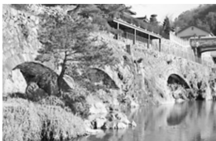
近代化産業遺産は、産業史・地域史を物語る33のストーリーとそれを構成する575件の遺産群から成ります。写真は鉱山関連遺産群の一つ・電気機関車専用軌道敷(トロッコ道)

これは、日本の産業近代化に大きく貢献した幕末から戦前にかけての建造物や機械、文書などの産業遺産を地域活性化に生かすことを目的として、同省が今回初めて公表したものです。わが国の官営鉱山として鉱業近代化