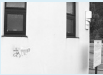
中央文化公園トイレの落書き