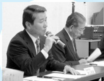
質問には市長はじめ、職員が回答