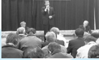
平成19年度 地区別懇談会