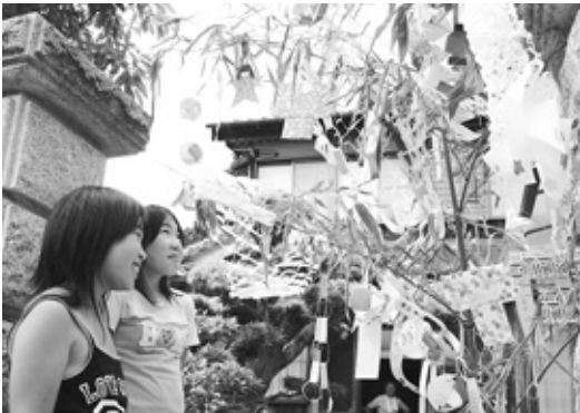
まちのあちこちできれいに飾られた七夕飾り

生野まちづくり工房井筒屋運営委員会は7月6日、生野町口銀谷地区で「銀谷の七夕」を行いました。