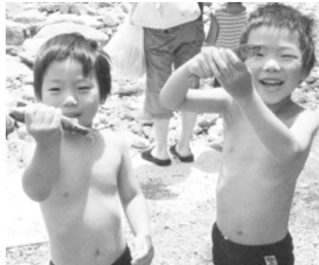
「ひらべ」捕ったよ!! (新町河川公園まつり)

魚釣りや川遊びなどの機会が多くなる夏本番を迎えた7月、各地で川に親しむイベントが行われました。