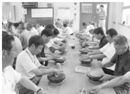
陶芸村で越前焼きに挑戦する参加者。出来上がった作品は、秋の文化祭に展示する予定。

東河地区協議会は7月6日と7日の両日、「ウル東河ワクワツツアー」を行いました。 このツアーは、同協議会が平成20年度の目玉事業として、地区住民の親睦と交流を深めようと開催。地区内から58人が参加しました。初日は福井県越前市の万葉菊花園を見学した後、越前町の陶芸村で越前焼きに挑戦。慣れない手つきながらも、力作を作り上げました。石川県の山代温泉で1泊した翌日は、福井県の大安禅寺などを訪問。帰路