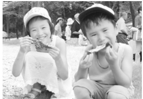
焼きたてのアマゴをガブリ(田路川ふれあい祭り)

今年で3回目の開催となるこのまつりは、平成15年度と同公園の完成を機に、一昨年から地元実行委員会が始めたものです。当日は、和太鼓の演奏など、趣向を凝らしたイベントの中で特に人気を集めたのが地元では「ひらべ」と呼ばれるアマゴのつかみ取り。公園脇を流れる白川で、自然の石で5ヶ四方に仕切った「いけす」に放たれたアマゴは二百匹。参加した子どもたちは歓声と水しぶきを上げながら懸命にアマゴを追いかけました。