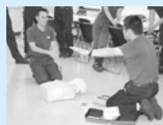
7月22日の講習会の様子

分かってきました。機械が手順などを音声で知らせてくれるので安心して操作できます。講習会の経験をいかして、いざというときに迅速に対応できるように心がけたいです。