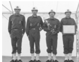
準優勝 生野支団第1団