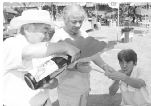
飲む時の茎の形が象の鼻に似ていることからその名がついたといわれる「象鼻杯」