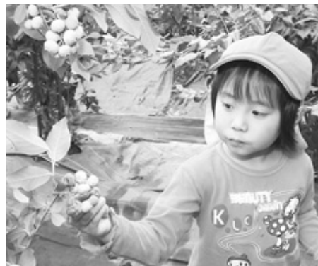
熟した青黒い実を選んで収穫