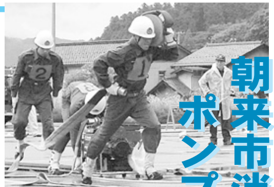
ポンプ操法に臨む選手