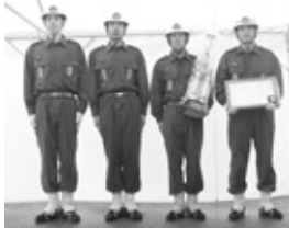
優勝 和田山支団第10団