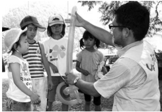
出来上がった作品に目を輝かせる子どもたち

朝来市子ども会主催の「親子でふれあいDAY in ASA GO」が7月13日、多々良木みのり館前の公園で行われました。このイベントは去年まで映画上映をメインにしていたのですが、今年は幼児から大人まで楽しめるものに企画を変更。多くの催しの中でひととき人気を集めたのは、細長い風船で帽子や剣などを作るバルーンアート。次々と作られる色とりどりの作品に「欲しい欲しい！」と子どもたちの列が絶えませんでした。