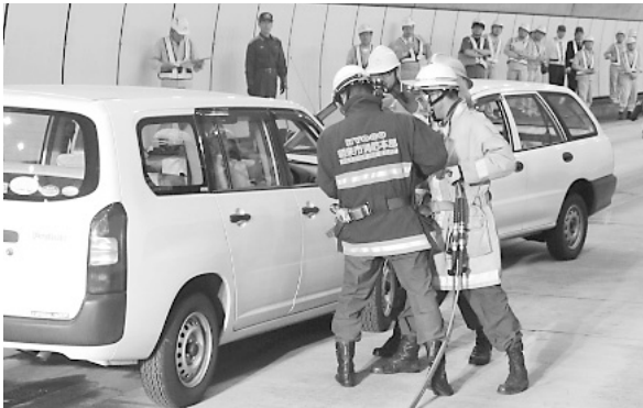
いつ起きるかわからないトンネル内事故を想定して訓練