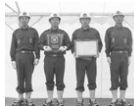
第3位 生野支団第2団