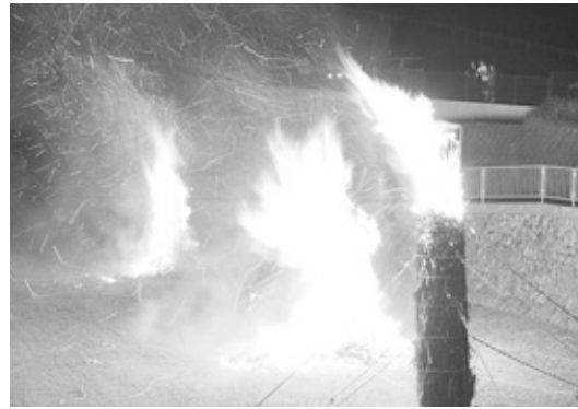
こうこうと燃える高さ6mの巨大松明3基

7月23日、和田山町竹田の朝来橋近くの河川敷で「松明祭り」が開催されました。 この祭りは、江戸時代の1762年（宝暦12年）、竹田地区を襲った大火事が二度と起こらないようにと、朝来山の愛宕神社に松明を奉納したのが始まりです。 松明から勢いよく燃え上がった炎が川面に映し出される幻想的な雰囲気の中、祭壇で火事災難からの無事を祈る神事や雅楽の演奏が行われました。