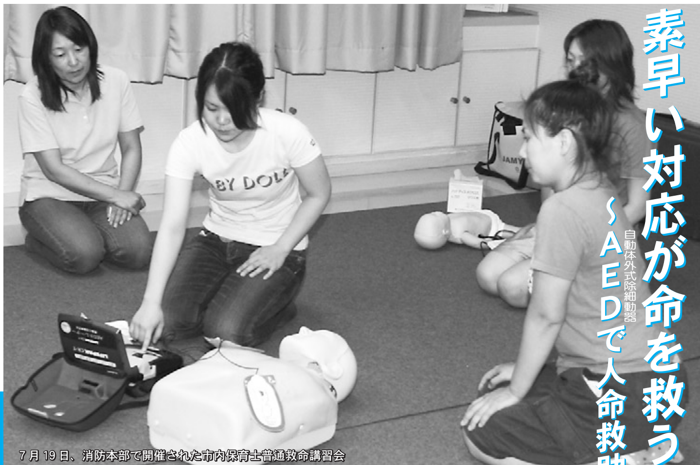
7月19日、消防本部で開催された市内保育士普通救命講習会

市内では、119番通報があつてから救急隊が現場に到着するまでの平均時間が約7分。その間に現場に居合わせた人が行う応急手当が救命率を大きく左右します。救急隊の到着までにできること——それは、心肺蘇生法（胸骨圧迫・人工呼吸）とAEDを使うことです。