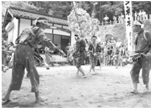
4百年前から続く伝統の踊りを披露