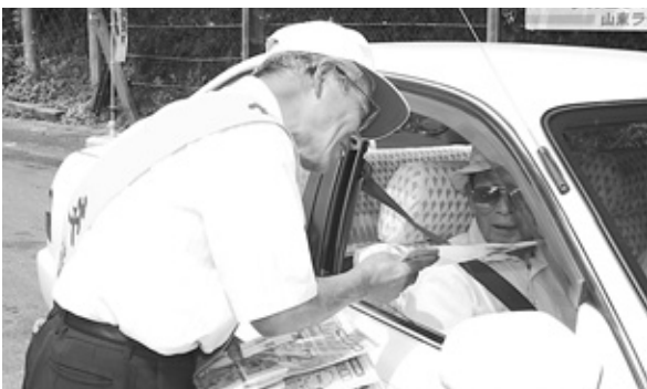
交通事故防止を呼びかける参加者(国道9号線「古茂池」全但バス停付近)

関係者らは、交通事故防止を呼びかけるチラシを手渡ししながら、「安全運転をお願いします。」とドライバーや来店者に声をかけていました。