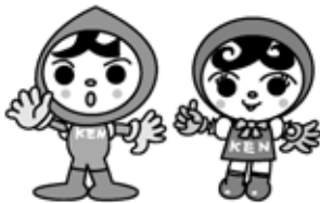
人権イメージキャラクター 人KENまもる君 人KENあゆみちゃん

人権推進共同参画課だより(3) 人権文化をすすめる市民運動・ 県民運動8月は強調月間です