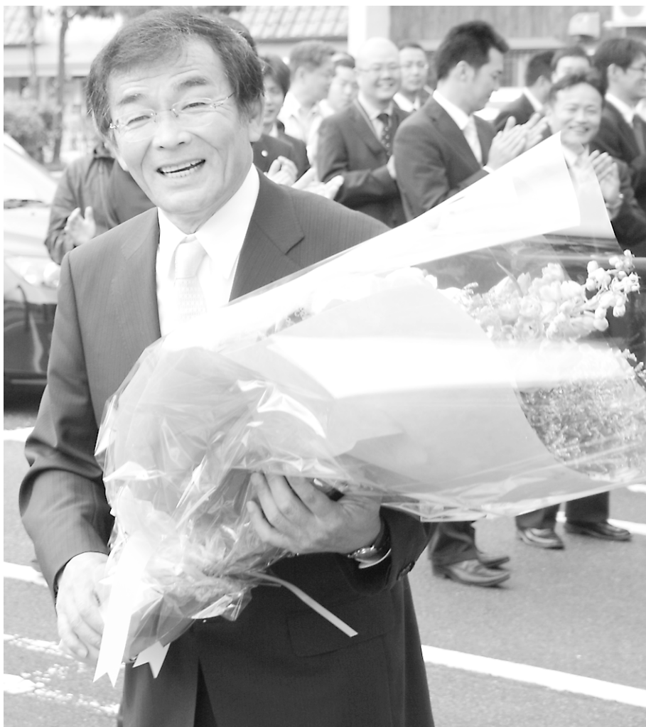
花束を手に、庁舎に向かう多次市長

多次市長の任期は、5月8日から4年間。今後は朝来市の新たなかじ取り役として、さまざまな政策を実現していきます。