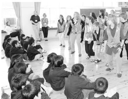
枚田小の児童の前でダンスを披露するシャヘイラムバレー中学生徒

ポーツや日本の食べ物や質問。授業の後には、テーパー中の生徒が梁瀬中の生徒に日本語でアンケートを聞き取り、互いに言葉が通じ合ったことを喜んでいました。