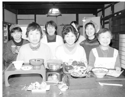
地元産の新鮮食材で作られた料理。料理名は食材の生産地名や家主の祖先の名前にちなんで名付けられています。

この古民家は、郷土資料館として使われている築50年以上の旧家。老朽化が進んでいましたが、地元住民の皆さんが協力して清掃作業や改装改築を行って準備を進め、この日のオープンとなりました。