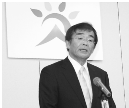
就任式で職員に訓示を述べる多次市長

多次市長は、初登庁後に和田山農業研修センター3階で行われた市長就任式で、「対話を基調とした心優しいぬくもりのある市政の実現を目指し、全力で取り組みたい」とあいさつ。朝来市の新たなスタートに強い決意を示しました。また、職員には「厳しい経済状況を認識し、今まで以上に知恵や力を出して必死に市民生活を守ることを第一に考えてほしい。市民の皆さんと積極的に対話し、力も借りながら、何事にも果敢に挑戦してほしい」と呼びかけました。 続いて開かれた記者会見では、本格予算を6月定例市議会に提案し、病院など医療の充実を目指す専門部署の設置などの機構改革にも取り組む方針を示しました。