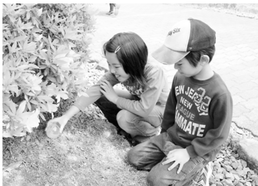
植木の下に...お宝発見!!

この日、特に人気を集めたのは、同公園内に隠された景品の引き換え番号が書かれた紙が入ったカプセルを探し出す「宝さがし」。子どもたちは、スタートの合図とともに、一斉に駆けずり回り、あちらこちらから「あつた!」「見つけた!」と歓声が響いていました。