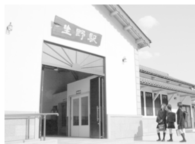
4月1日に生野駅西口に完成した「生野駅交通センター」。駅舎内には、切符売場や待合室があります。今後は情報センターを設置する予定です。