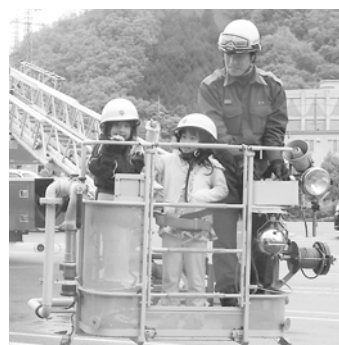
ビル火災などに出勤するはしご車に体験乗車する子どもたち

この日行われたイベントは、消防車や救急車などの体験乗車、起震車による地震体験など盛りだくさん。中でも、はしご車の体験乗車には、多くの子どもが参