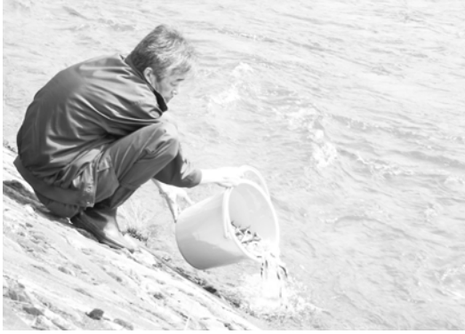
「元気に大きく育て」と願って放流

皆さんの周りの身近な出来事や話題をお知らせください。 市役所秘書広報課 ☎ 672-6111