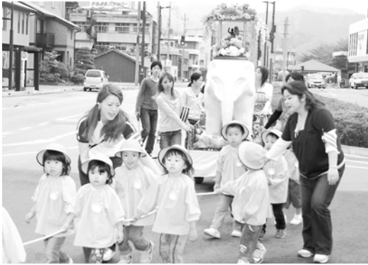
白象を引く園児たち