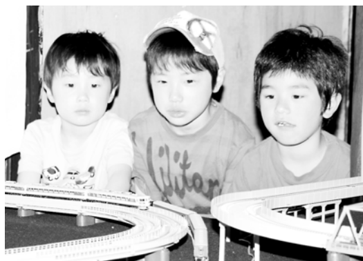
鉄道模型を楽しむ子どもたち

3年前の播但線全線開通百周年をきっかけに始まったこの祭りは今年で4回目。会場ではミニSLの運行や昔の遊び体験コーナーなどさまざまな催しが行われました。中でも、鉄道模型「Nゲージ」の展示会場は、子どもたちに大人気。1周約10分のレールを走る鉄道模型に、思わず身を乗り出して見入る子どもたちの姿が見られました。