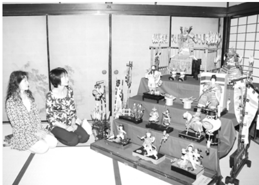
井筒屋に飾られた五月人形

生野まちづくり工房井筒屋運営委員会は5月5日から6月5日まで、生野町口銀谷地区で「銀谷のわらべ」を開催しました。これは、五月人形など端午の節句にちなんだものを飾る催しで、今年も同地区の約30軒の民家や商店が参加しました。井筒屋では、明治時代の人形を含め4点を展示。甲冑を身に付けた武将や金太郎、白馬などや、表情や仕草が豊かな五月人形などが訪れた人たちを楽しませていました。