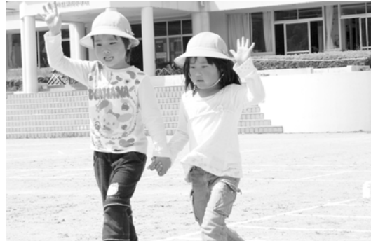
運動場で手を上げて横断歩道を渡る練習をする東河小学校児童

東河小学校は5月11日、交通安全教室を行いました。これは、交通事故を未然に防ぐため、児童に交通安全の認識を深めてもらうことを目的として毎年行われているもの。この日は、同校の児童百18人が交通ルールを学びました。1・2年生の児童37人は運動場で横断歩道の渡り方を勉強。2人1組になって「右よし。左よし。右よし」と声を出して左右の安全を確認しながら真剣な表情で取り組んでいました。