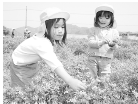
ピンク色のレンゲの花摘みを楽しむ園児たち