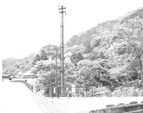
神子畑区内に整備された携帯電話の基地局