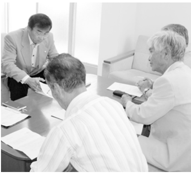
参加者からは地域が抱える課題についてお話を伺いました。

これは、市長が月に1度、生野、山東、朝来の各庁舎で一日勤務し、市民の皆さんの市政に対する思いや意見を直接聞いたり、市内を巡回したりして地域の実情を見て回るもの。第1回目の開催となったこの日は、6人の皆さんが参加し、さまざま