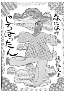
「じろはったん」 (児童文庫) 森はな・作 梶山俊夫・画 アリス館(1,400円)

それからひと月後、新やん戦死の知らせが届きました。南方へ行く途中、船が魚雷に当たり海に沈没したのです。死んでしまったことを理解できないじろはったんは、何回復