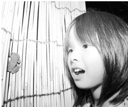
池のそばに立てかけてあったすだれにモリアオガエル発見!!

生野町黒川にある日本ハンザキ研究所は6月6日、同研究所周辺で「モリアオガエル観察会」を開催。親子連れなど7人が参加しました。 参加者は、同研究所裏の池の中を泳ぐ体長5〜7cmのモリアオガエルを観察。また、草むらに産み付けられた泡状の卵の塊を見つけると、興味津々の様子で見入っていました。