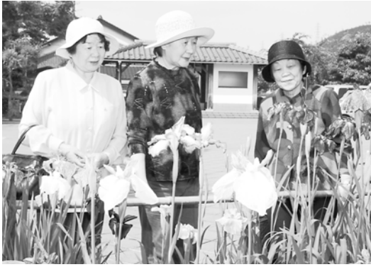
虎臥城公園に咲く白や紫の花しょうぶ

皆さんの周りの身近な出来事や話題をお知らせください。 市役所秘書広報課 ☎ 672-6111