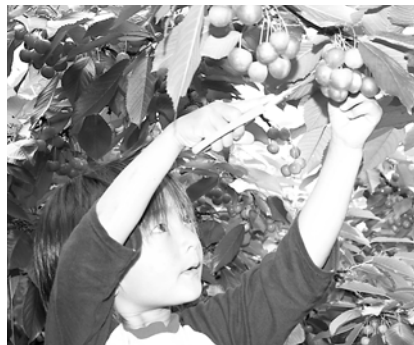
赤く色付いたサクランボの実を摘み取る東河幼稚園の園児

園児たちは、手を伸ばしたり台に登ったりして、赤く色付いたサクランボの実を収穫。その後の試食では、採れたての実を口にはおぼり、「甘くておいしい」などと歓声を上げながら、初夏の味覚を堪能していました。