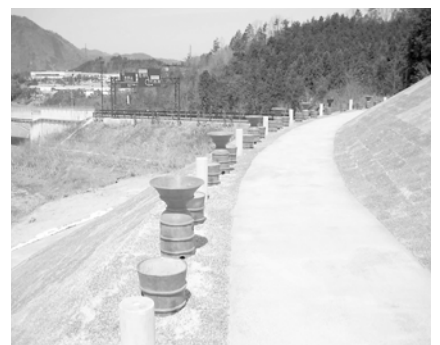
茶すり山古墳で復元された埴輪列