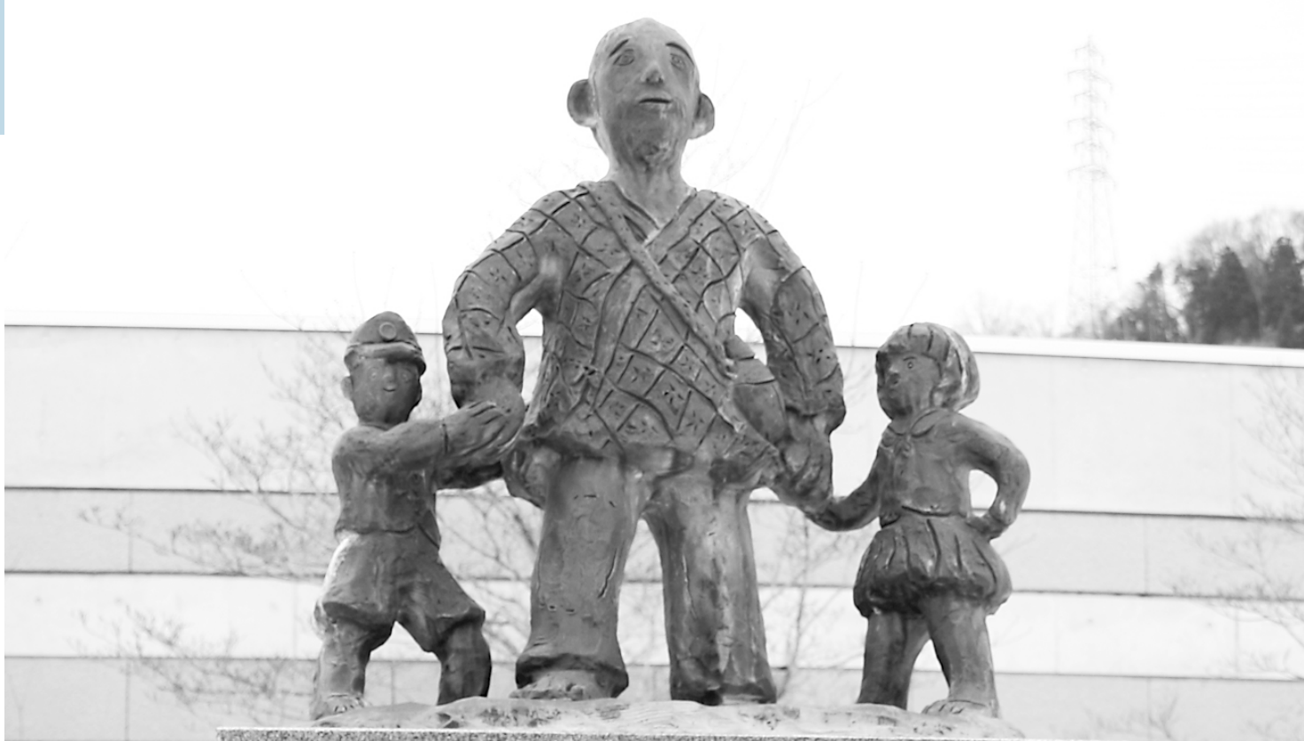
和田山図書館前にある じろはったんの銅像