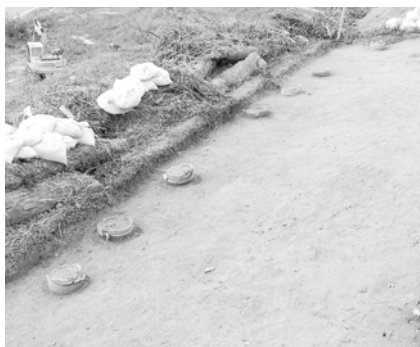
茶すり山古墳で見つかった埴輪列

なぜこのように使われ方が変化するのでしょうか。古墳とは、死者を葬る場所だけでなく、死者の生前の権威を誇示するためのステージであるとともに、次の支配者の権威付けをするための空間でもあったと考えられています。埴輪は、この神聖な舞台の周囲を囲むことにより、視覚的