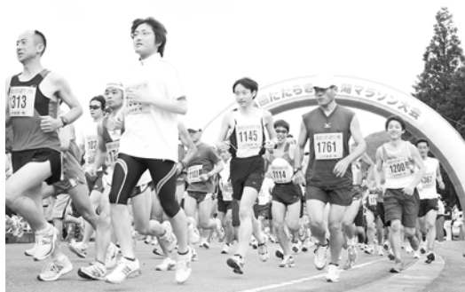
号砲を合図に一斉にスタート

スタート直後の高低差約百メートルの難コースが有名なこの大会には、今年は計2千四百人のランナーが参加しました。レースでは、ジョギングコースのスタートを皮切りに、ハイフマラソン、5キロ、10キロの各コースが順次スタート。参加者は、新緑の山々と青い水をたたえたダム湖を背景に健脚を競いました。