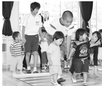
園児の手を引いて横断歩道を渡る練習を手伝う中学生

われ、同署で体験活動中の和田山中と朝来中の4人が交通安全指導の手伝いを行いました。