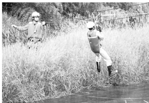
川の中州に取り残された男性を両岸に渡したロープを使って川岸に送る救助隊員