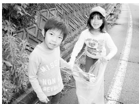
ごみ拾いに励む参加者の中には子どもの姿も(山本区)

これは、「ごみのない美しい地域づくりをしよう」と但馬各市町が統一事業として毎年行っているもの。市内各地でたくさんの方が参加し、自分たちの住んでいるまちをきれいにしようとしてごみ袋を手に空き缶や空きびん、ごみ拾いに精を出しました。