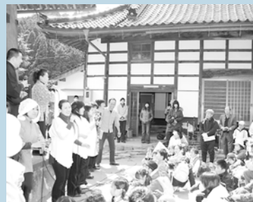
法泉寺でのコーラスの様子

200人が参加して行われた「じろはったんウオーク」。参加者は養父駅をスタートし、大蔵小学校などを巡りました。法泉寺では日本ミュージカル研究会・但馬ミュージカル研究所の皆さんが「ミュージカルじろはったん」のコーラスを披露し会場を盛り上げました。ゴールの大蔵地区市民会館では、じろはったん鍋が振る舞われ、参加者は舌鼓を打っていました。