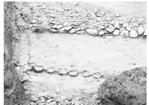
池田古墳で見つかった埴輪列

発掘調査はわたしたちにとっていろいろな新事実を提供してくれます。昨年度、和田山町平野区にある池田古墳で発掘調査が行われ、「渡土堤」と呼ばれる堤をはじめ、古墳を構成する様々な装置が発見されました。今回はその中でも代表的なもののひとつ、埴輪を紹介しします。