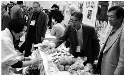
兵庫県公館(神戸市)で行われた都市部との交流会場で奥銀谷地域で採れた新鮮野菜を販売(奥銀谷地域自治協議会)