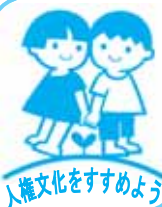
人権文化をすすめるよう