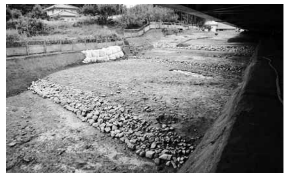
池田古墳の造り出し遺構(県立考古博物館調査)

させたような形の古墳も存在しています。今回はこの前方後円墳に設置された一つの装置である「造り出し」を紹介しましょう。