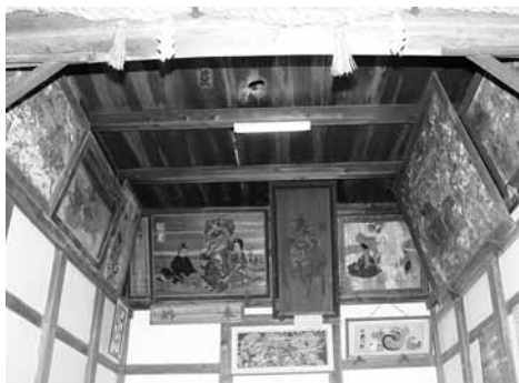
當勝神社絵馬群 (21点。近世・近代の絵馬が多数現存)