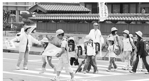
交通事故や犯罪から子どもたちを守る「見守り活動」を実施(竹田地域自治協議会)