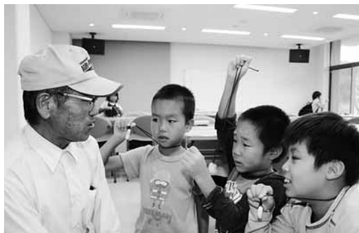
「見て見て、うまく作れたよ!」とまが玉の出来栄を競う深江地区の子どもたち

神戸市東灘区深江地区と諏訪区の交流事業が9月12日、諏訪区公民館などで行われ、深江地区の子どもたち35人が地元の方々と交流を深めました。 この日は、朝からの雨で稲刈りやイモ掘りなどができず、予定変更。埋蔵文化財センターで、諏訪区の皆さんと一緒にまが玉作りを体験しました。子どもたちは、楽しみにしていた外での作業の替わりに、好きな形に磨いて作る自分だけのまが玉作りを満喫していました。