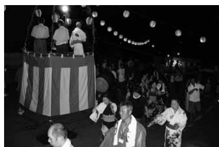
夏の風物詩「盆踊り」を地域をあげて50年ぶりに開催(粟鹿地域自治協議会)