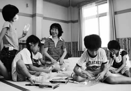
与布土小児童が、宿題をしたり遊んだりして、放課後与布土地域自治協議会の事務所(与布土地区コミュニティセンター)で過ごします(地域学童保育)