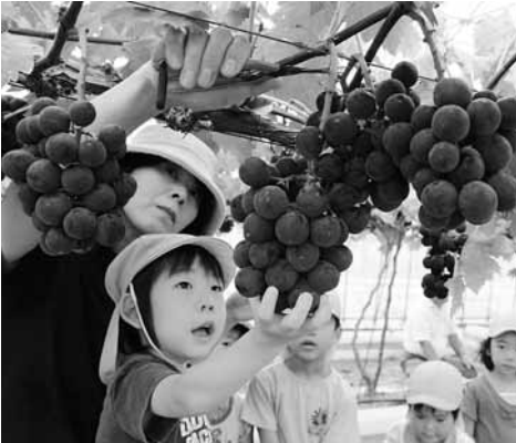
たわわに実ったぶどうを収穫する園児。この後たっぷり味わいました。

東河保育所の園児28人が8月 28日、東河観光農園でぶどう狩 りを体験しました。