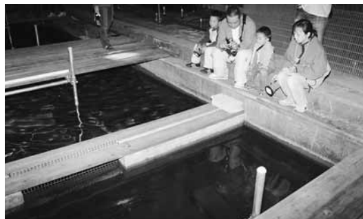
夜の飼育プールを観察する参加者。プールの中では夜行性のオオサンショウウオが活発に動き回っていました。

日本ハンザキ研究所は9月19日、同研究所で「オオサンショウウオ観察会」を開催。市内外から20人の親子連れなどが、別名「あんこう」や「ハンザキ」と呼ばれる「オオサンショウウオ」を観察しようと同研究所を訪れました。参加者は、研究員に生態などの話を聞いた後、飼育プールで保護飼育中の約百匹を観察。大きいものでは、百疋を超えるオオサンショウウオが動き回る姿を興味津々の様子で観察していました。