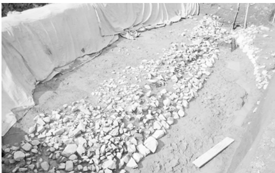
池田古墳の後円部と造り出し遺構(朝来市調査)

古墳の形にはさまざまなの があります。我がまち朝来 市にもたくさん古墳が存在 しています。その多くは円形 の古墳(円墳)ですが、前方後 円墳という円形と方形を合体