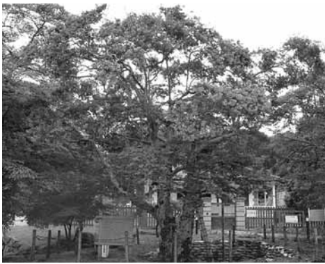
神子畑のサルスベリ (但馬では珍しいサルスベリの古木)

市指定文化財の指定は合併後初めて。これで市内の文化財は、国指定7件、国登録8件、県指定30件、県登録4件、市指定百24件、合計百73件となりました。