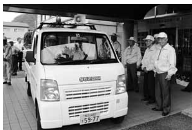
いくつかの地域自治協議会の青色回転灯を付けた自動車地域内のパトロールに出發