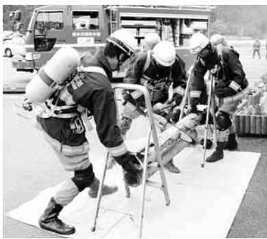
チェーンソーで施設入口前の障害物を取り除く隊員

「複数の負傷者が発生するような災害や事故の場合、消防本部だけでは対応できない。有事の際は皆さんの協力をお願いしたい」と述べました。