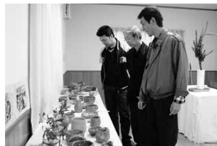
東河地区文化祭では、地域の皆さんの作品を多数展示(東河地区協議会)

交流イベントなどにより顔見知りの地域社会が作られ、それらを通して地域住民相互の信頼関係が生まれ、身近に直面する地域課題の解決へと活動がつながっていきます。