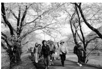
和田山地区地域自治協議会の設立記念ふれあい交流イベント「お花見ウォーキング」では参加者が桜満開の与布土川、円山川沿道を散策

夏休みを前に行われた「みんなのラジオ体操会」では多くの人が心地良い汗を流しました(梁瀬地域自治協議会)