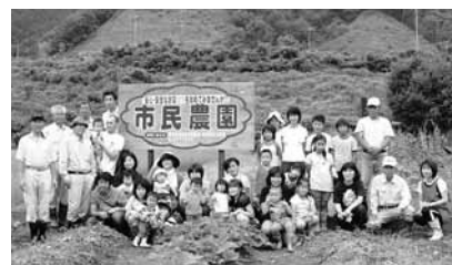
朝来地域自治協議会の市民農園。子育て支援活動事業の一環でサツマイモの苗の植栽を行った参加者。秋の収穫が楽しみ。