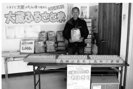
大蔵地区の田んぼで収穫したお米を販売(大蔵地区地域自治協議会)