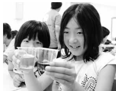
濃い青色をしたマローブルの液体(右)とレモン汁を入れて薄い色になった液体(左)の変化を観察する児童たち

講師を務めたのは、岡山理科 大学教授の赤司治夫さんと同大 学生4人。児童らは、赤司さんら の説明を聞いた後、早速実験を 始めました。酸性は赤、アルカリ 性は黄色に変わるというこの液