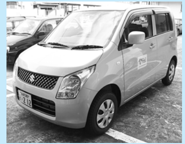
各地域を訪問するために購入した車両