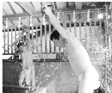
冷水をかぶり、厄を払う男性

2月14日、佐中の深高寺で厄除けを祈願する「星まつり大講」が開かれ、寒中水行の奉納が披露されました。 この水行は昭和52年から続く恒例行事。この日は、男性5人が、2組に分かれて上半身裸で下帯姿になり、経文を唱えながら勢いよく冷水をかぶりました。 激しく飛び散る水しぶきに、集まった多くの人が歓声を上げていました。