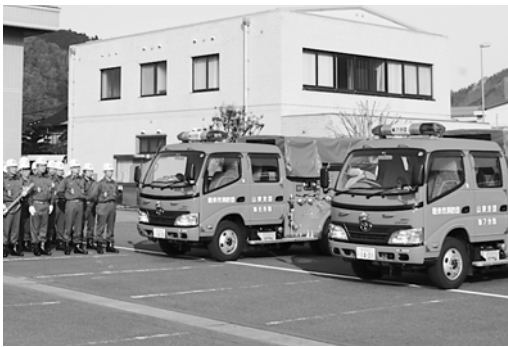
山東支団第6分団と第7分団の両分団に引き渡された最新鋭のポンプ自動車

式では、多次市長が「有事の際にはこのポンプ自動車の性能を十分に引き出して消火活動などを行ってください」と呼び掛け