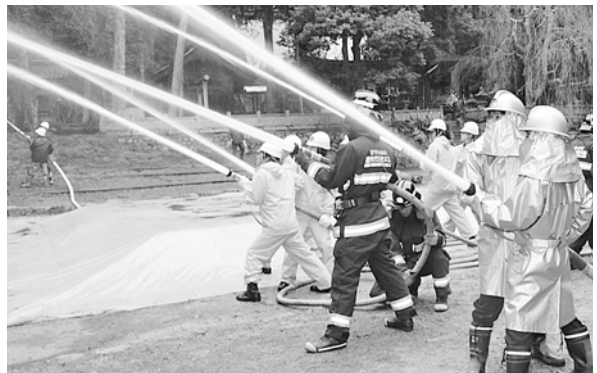
貴重な文化財を失わないように訓練

この日は、55人の皆さんが「赤淵神社本殿から出火、裏山に延焼中」との想定で訓練を開始。冷たい雨の降る中、消火栓や放水水槽からのポンプ車による放水訓練に取り組みました。