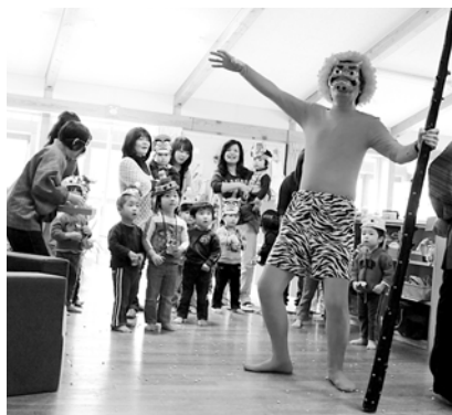
園児に豆をぶつけられ、退散する赤鬼