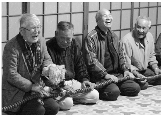
願いを込めて、数珠を繰る

2月3日、上岩津の鷲原寺で節分恒例の「数珠繰り」が行われ、地元を中心に集まった約50人の皆さんが今年一年の無病息災などの願いを数珠に込めました。