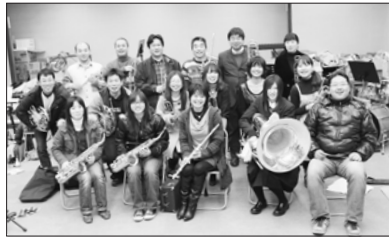
定期演奏家に向けて練習に励む朝来市ウィンドアンサンブルのメンバー

朝来市ウィンドアンサンブルは、朝来市を中心に、但馬の愛好家で作る吹奏楽団。「吹奏楽の楽しさを多くの人に知ってもらおう」と平成15年1月に結成しました。当初16人だった団員は、現在では市内外の高校生から社会人まで30人が所属。「地域に根ざした音楽活動」をモットーに、市内はもとより但馬各地で開催される行事に参加しています。また、レベルアップを目指して、さまざまなコンクールに出場。県吹奏楽コンクール銀賞などの賞を受賞してきました。