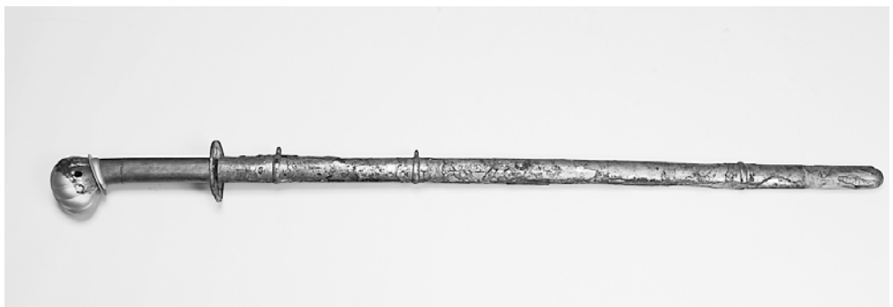
朝来市埋蔵文化財センターで展示公開している「長尾古墳」出土の「金銅装頭椎太刀」

しかし、6世紀から7世紀にかけて作られた横穴式石室という古墳から出土するものの中には、しばしば「金銅装太刀」という豪華な副葬品が納められていることがあります。「金銅装太刀」とは、銅板に金と水銀の合金を塗り、加熱してメッキしたものを刀の鞘や柄の表面に装飾したものです。武器としてだけでなく美術工芸品としても重要なものです。また、このメッキ方法は、「金アマルガム法」といいます。こ