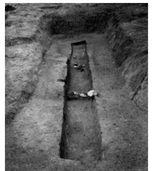
城ノ山古墳の埋葬施設

真ん中の部屋に遺体が埋葬され、その遺体の周囲に立派な副葬品が供えられていました。注目されるのは三角縁神獸鏡をはじめとする銅鏡が6面も供えられていたこと。ところが城ノ山古墳に葬られた被葬者は三角縁神獸鏡でない縁の平らな鏡(以下、平縁と称します)を重視していたようで頭の近くに供えられ、三角縁神獸鏡は足元に置いていました。三角縁神獸鏡という鏡は中国「魏」の時代に鑄造された鏡で、当時の大和の大王から服属を誓った証として各地の王に配られた一種の宝物として考えられています。城ノ山古墳に葬られた被葬者も大和から授かったものと考えられます。このような、埋葬施設の形や副葬品の内容から、城ノ山古墳の被葬者像は大和の大王と「よしみを通じ」ながら、