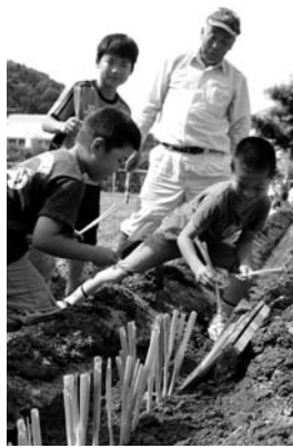
岩津ネギの植え付け体験