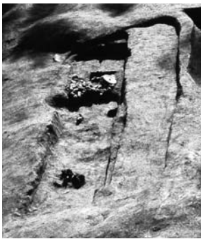
馬場 19号墳の埋葬施設

その他に、棺内を分割するという行為において共通する事例として、馬場19号墳(山東町柿坪)があります。遺体が埋