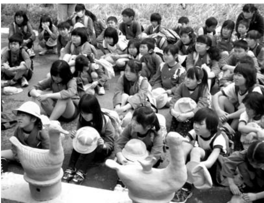
大蔵小学校「春の遠足」