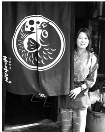
町屋カフェ 竹田町屋 寺子屋

市と市商工会は、竹田の城下町の街並みを活かした地域活性化を目的に、空家を活用したチャレンジショップの出店者を募集していました。このたび、町屋カフェ「竹田町屋 寺子屋」の