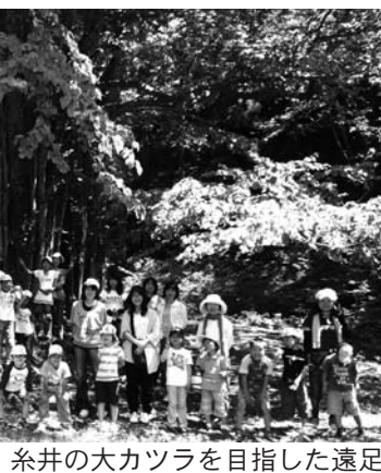
糸井の大カツラを目指した遠足