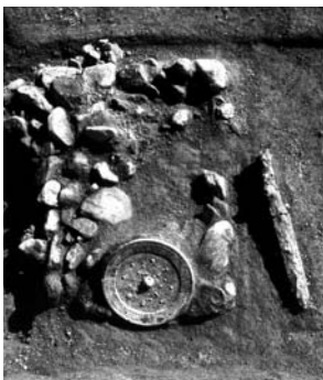
馬場 19号墳銅鏡出土状況

葬されていた主室を中心とするの両側に副室を設け、三室構造としているもので、主室からは平縁の銅鏡が納められていました。鏡の形式は「方格規矩鳥文鏡」と呼ばれるもので、城ノ山古墳から出土した鏡の形式と同じものです。平縁の銅鏡とは中国の「漢」の時代に製造されたもので、三角縁神獣鏡よりも古いものなのです。また「手ずれ」と呼ばれる摩擦痕が見られることも共通する要素です。要するに大切に使い込まれていたこの銅鏡は、数世代にわたって伝えられてきた「宝器」であり、地域を治める人物のシンボルともいえます。