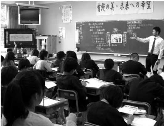
電子黒板を使用した授業