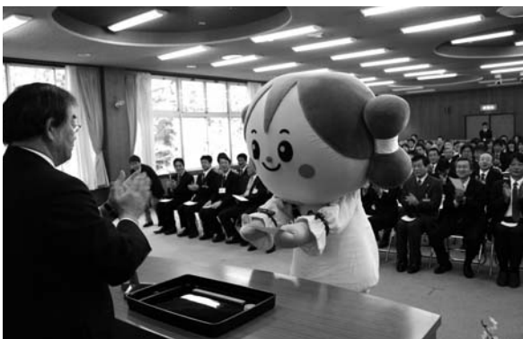
辞令を受け取るちやすりに大きな拍手が送られました。

ちやすりんの所属は、産業経済部観光交流課。多次市長が「朝来市のPRをお願いします」と激励すると、ちやすりんは元気いっぱい動きで応えていました。今後、各部に「ちやすりん」担当を設置し、各部署が行うイベントでの活用や、多くの市民に利用していただくよう計画しています。