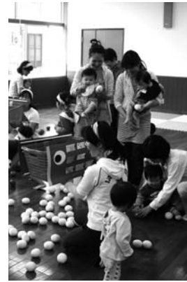
子育て学習センター