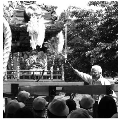
屋台について説明を受ける児童