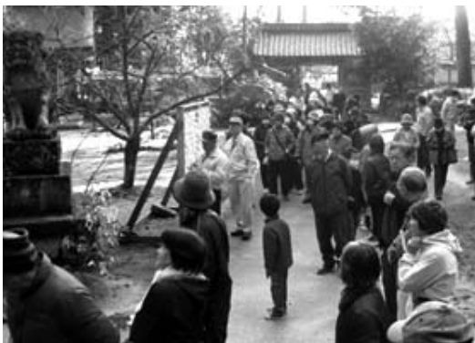
粟鹿神社に集まる参加者

当日は地域内外の子どもから高齢者まで70人の参加のもと、粟鹿神社、日下邸、西谷地藏、當勝神社、鹿園寺、山東アウトドアビレッジなどを半日かけて散策。地元の人にとっても新たな発見が多くあり、楽しいひとときを過ごしていました。参加者は「今回のコースになかった名所を是非巡りたい」と次回の開催を期待していました。