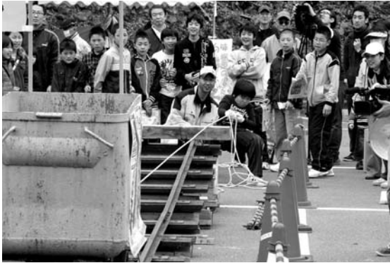
応援を力に変えてトロッコを引く参加者

皆さんの周りの身近な出来事や話題をお知らせください。 市役所情報政策課 ☎ 672-6116