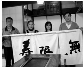
お好み焼き屋 寿限無(じゅげむ)

また、市内の空家・空き店舗を利用して出店に対する補助事業を活用し、お好み焼き屋「寿限無」も4月5日に開店しました。