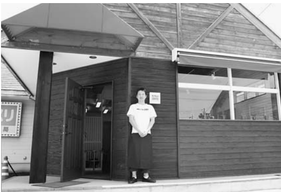
この事業を活用してオープンしたお店としては3店目