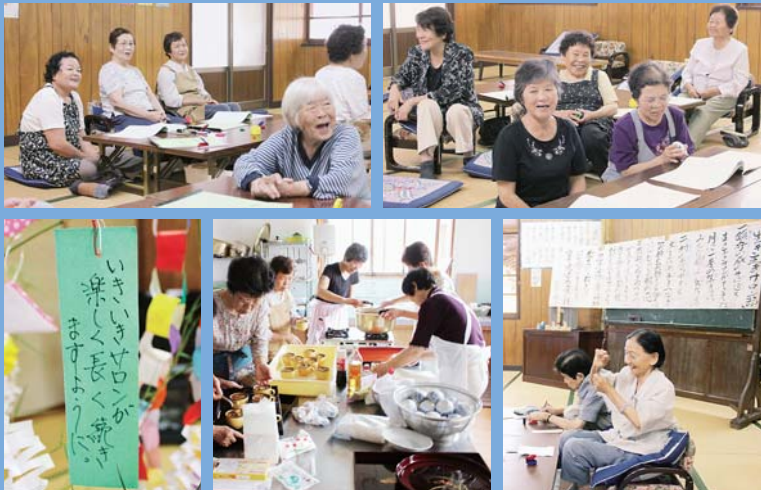
7月に行われた「いきいきサロン」の様子

和田山町林垣区の婦人ボランティアが中心となって開催している「林垣いきいきサロン」。地区の高齢者が集まる交流の場は、いつも笑顔があふれています。