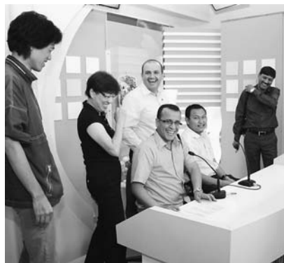
番組制作を体験する研修員