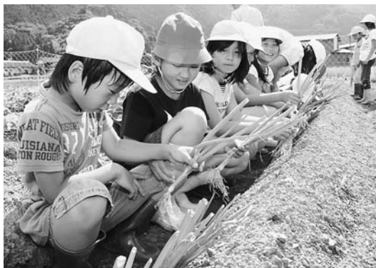
ネギの苗を植える山口小児童

朝来地域自治協議会や地元農家、市などが協力して、朝来地域の小・中学生に岩津ネギの植え付け、収穫などを体験させる地元特産品体験学習事業。地域への誇りや愛着を持つてもらおうと昨年度から行われています。