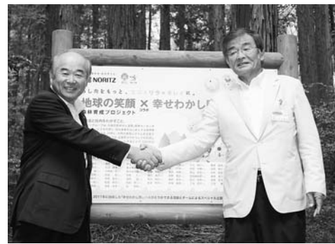
PR看板の前で握手をする國井社長(左)と多次市長