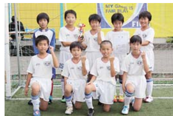
第3位：F C和田山ウイングス

7月7日に日高で行われた上記の大会において、朝来市内のチームが優秀な成績を収めました。今年12月に行われる県大会への出場枠は但馬全体で3枠。その全てを朝来市のチームが獲得しました。県大会でも全力で闘います！