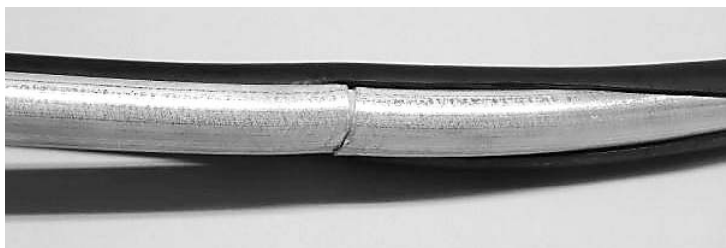
左：幹線の同軸ケーブルに入った亀裂 右：自主放送番組の制作風景