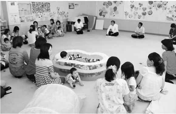
当日は22人の母親が参加。活発な意見交換がされました。

6月28日に和田山公民館で行われたふれあい市長室は、対象を地域ではなく、子育て中の母親に設定して開催。楽しみながら子育てができる社会、づくりをテーマに、「近くに公園がほしい」「市内に産婦人科があれば助かる」「こども園の長時間保育について柔軟な対応を」など、母親の立場から市政に対して多くの意見が出ました。