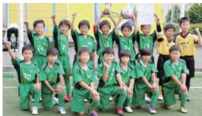
準優勝：山東F Cアンドレーナ