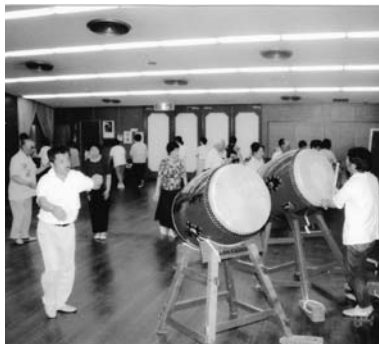
山東町盆踊りの講習会

成17年4月1日からは市指定)しています。山東町の盆踊りは音頭や踊りの形式・内容から見て江戸中期以降から踊られたものと考えられています。また、音頭に段文・吉川などを含んでいることや、念仏踊り以来の輪踊りにいろいろな音頭を結合させていることなどから、播州系統との共通点が見られます。具体的には、中央に檜 ひのき を組み(以前は餅つき臼を円形に並べて何段かに積み上げ(梁瀬の一部では大酒樽借用)、中央に傘を高く立て(今も音の放散防止も兼ね)、その周囲に音頭取りが数人上って円陣を作ること。踊り子(老若男女、子どもまで)は何重かの円をなして踊り回ること。楽器は大太鼓一張りのみ。といった特徴がある。