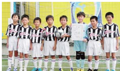
優勝：朝来F Cチェルピアット