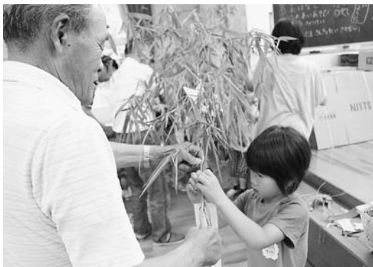
願い事を書いた短冊を笹に取り付ける園児

7月6日、七夕の日を前に、川幼稚園で園児の祖父母や地域の方を招待し、七夕会が行われました。同園の4、5歳児28人が童謡「たなばたさま」を歌ったり、鈴やカスターネットを使って合奏を披露。参加者は大きな拍手で応えていました。