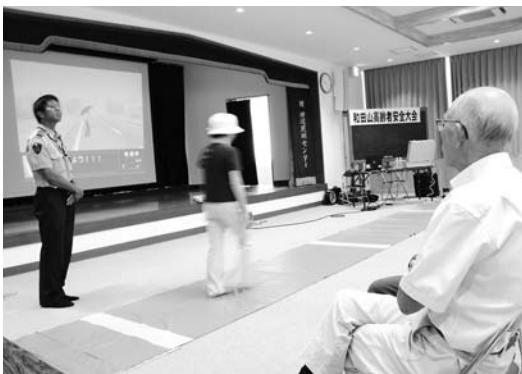
歩行者教育システムを体験する参加者

当日は、和田山校区老人クラブの約70人が参加。県警本部の高齢者交通安全協力隊「スタウス」の2人が楽しく分かりやすく交通ルールを説明しました。参加者は、道路横断の疑似体験ができる「歩行者教育システム」を使うなど、交通安全の基本を学んでいました。