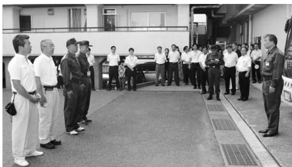
7月26日、出発式で多次市長から激励を受ける職員(手前2人は養父市職員、奥の2人が朝来市職員)

朝来市と竹田市は、「竹田」という地名や、山城を有するなど共通点が多く、今後、交流を進めていこうとしている矢先に災害が発生しました。竹田市長から多次市長へ支援の要請があり、朝来市と養父市から職員を派遣することが決定。職員は、7月26日から8月3日までの9日間、農地農業用施設の災害査定業務に従事しました。