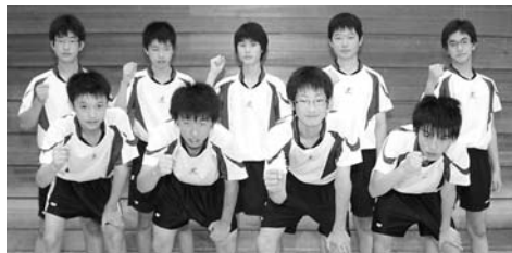
第43回全国中学校卓球大会 男子団体の部 和田山中学校卓球部