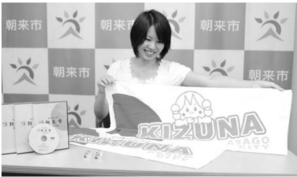
バッチ(300円)とタオル(800円)は、市役所まちづくり課で購入可能です。

今回作ったのは、タオルとピンバッチ、朝来市の紹介DVDの3種類。タオルとピンバッチは同じデザインで、市マスコットキャラクター「ちやすりんと」、交流をより深めようと「KIZUNA(ぎずな)の文字が大きくプリントされています。また、DVDは、英語、中国語、韓国語の字幕付きで、市の名所のほか、市内の国際交流事業や日本語教室の様子を収録しています。