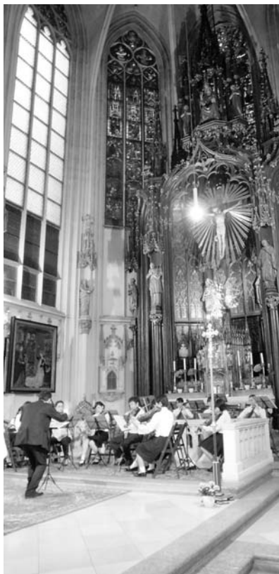
歴史ある教会で行われた友好演奏会

朝来市少年少女オーケストラは、世界最高峰の音楽文化とその歴史を体験し、本格的なクラシック音楽を学び朝来市の音楽文化の発展につなげるため、8月3日から9日まで、オーストリア国ウィーン市へ団員22人を派遣しました。 団員らは、音楽関係施設の訪問や音楽鑑賞のほか、音楽講座を受講。また、友好演奏会に向け、訪問先などに手作りのチラシを配り参加を呼びかけました。 そして、平成12年の訪問以来、約10年ぶりとなる「第2回ヨーロッパ遠征友好演奏会」を8月6日、ウィーン市のマリア・アム・ゲシュターデ教会で開催しました。プライナー音楽院の生徒2人と一緒に計7曲を演奏。1000人を超える観衆が演奏を聴き、客席からは「ブラボー」と演奏を称える声も。団員たちは