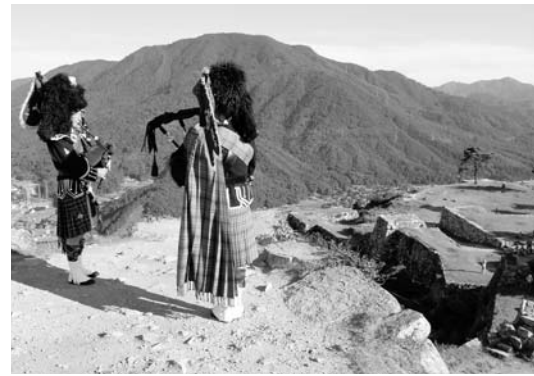
竹田城跡の天守閣でバグパイプの演奏

7月30日から8月5日まで、ASAGO国際音楽祭2012が行われ、プロの演奏家による様々なイベントが催されました。7月31日と8月3日には竹田城跡でスコットランドの民族楽器「バグパイプ」の演奏が、暑い日差しの中、竹田の山あいに独特の音色が響き渡りました。 また、ファイナルコンサートでは、東日本大震災でがれきとなった流木で作られたヴァイオリンの演奏も、訪れた人は、その音色に聴き入っていました。