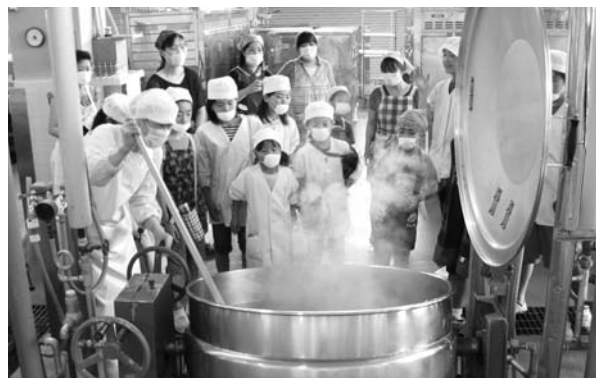
調理場を見学する参加者ら