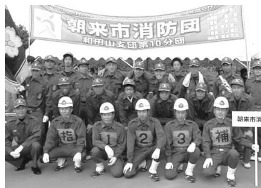
団員が一致団結して操法に取り組みました。

8月5日、三木市の県広域防災センターで「第24回兵庫県消防操法大会」が行われ、市の代表として、和田山支団第10分団が小型ポンプの部に出場しました。当日は県内からポンプ自動車の部、小型ポンプの部にそれぞれ9隊が参加。大きな声援が響く会場で各チームが技を競い合いました。 第10分団は、惜しくも上位入賞を果たせませんでした。県大会にふさわしい見事な消防操法を披露しました。