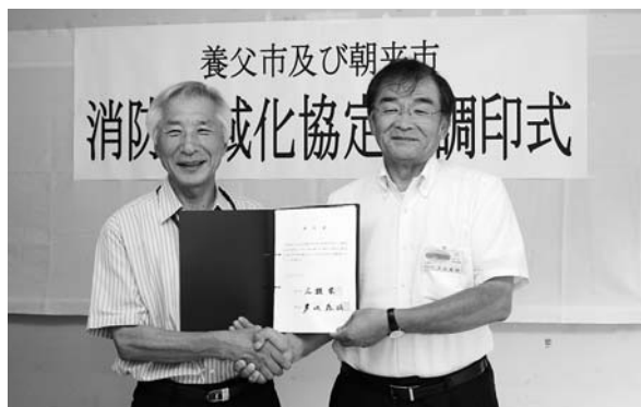
調印書に署名した多次市長(右)と広瀬市長