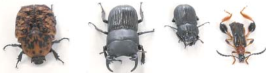
左から、アカマダラコガネ、ネプトクワガタ(オス、メス) スネケブカヒロコバナカミキリ。いずれも平成24年採集

今年は春先から初夏のころまで変な天気が続きました。「変な天気」は、虫の世界にも色んな影響を与え、変わった虫が続々登場！