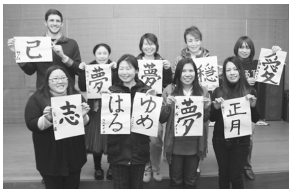
作品を手に満足そうな表情を浮かべる参加者

1月15日、山東公民館で朝来市連合国際交流協会によるあさご日本語教室が行われました。この日は、新年最初の教室ということで書き初めに挑戦。9人の外国人学習者らは、用意された「夢」や「正月」などのお題の中から一つを選び、ポランテアから筆の持ち方や運び方を教わりながら半紙に力強く書き上げていました。