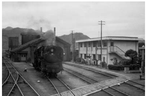
昭和45年ごろの和田山機関庫