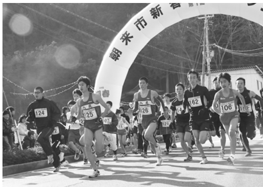
新春の町並みを駆け抜けました

1月1日、市役所本庁舎周辺で、第1回朝来市新春マラソン大会が行われました。昨年まで計40回行われてきた和田山新春マラソンを市体育協会が継承する形で開催され、参加者は新年の走り初めを楽しんでいました。当日は、市内外から約2000人のランナーが集まり、すがすがしい晴天の中、平成25年のスタートを切りました。沿道には多くの市民らが応援に駆け付け、選手に暖かい声援を送り、選手も笑顔で応えていました。