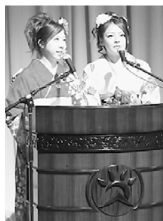
司会者(成人のつどい)

1月13日、市は、和田山ジュピターホールで平成25年朝来市成人式を開催しました。今年新たに成人を迎えたのは384人。華やかな振袖や真新しいスーツに身を包み、会場のあちこちで友人との再会を喜び、記念撮影や近況を話し合う姿が見られました。式典では、新成人代表による誓いのことばが述べられ、新成人らは真剣な表情で聞き、大人としての決意を新たにしていました。また、式典の後には、自らが企画した「成人のつどい」が行われ、お笑い芸人のステージや、懐かしいスライド写真の上映など様々な催しのほか、新成人代表から家族へあてた感謝のメッセージが読み上げられました。