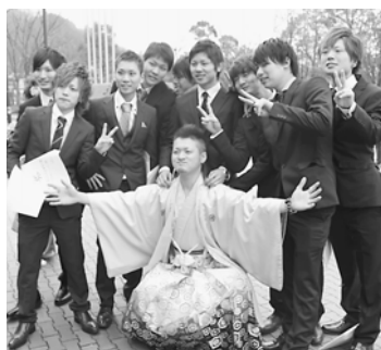
友人との懐かしい再会