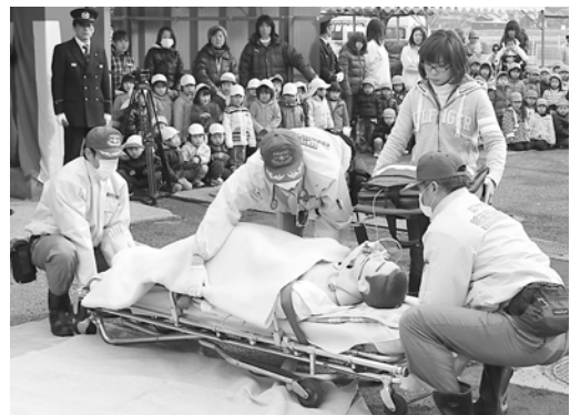
救急訓練には市民も参加しました。