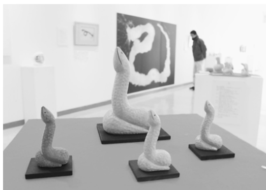
色んなへびが美術館に集合

また、「干支絵手紙コンクール」も1月14日まで同館で行われ、趣向を凝らした291点の年賀状が壁一面に展示されました。