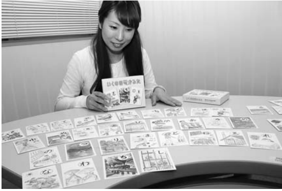
1セット500円で、市社会福祉協議会各支所などで販売

皆さんの周りの身近な出来事や話題をお知らせください。 市役所情報政策課 ☎ 672-6116