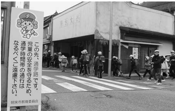
竹田小学校の通学路に設置された看板

全国で登下校中の児童らが事故に遭う事例が後を絶たないことから、市教育委員会は、昨年の夏に朝来警察署や道路の管理者、小中学校の教職員らと通学路の点検を実施。住宅が密集し、歩道がなく、交通量の多い道路については、通学時間帯に、なるべく車両の通行を控えてもらうことを促す看板を設置することとしました。