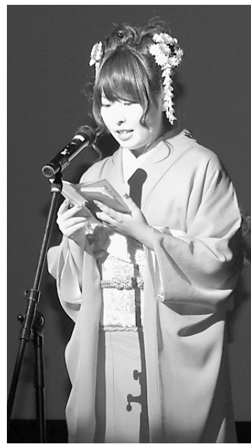
家族へメッセージを伝える