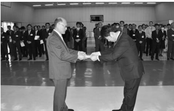
山元町長に義援金の目録を手渡す坂本副主幹

1月7日に山元町で行われた辞令交付式で、派遣職員は辞令を受け取り、和田山ライオンズクラブと市少年少女オーケストラから預かった義援金を山元町長に手渡しました。