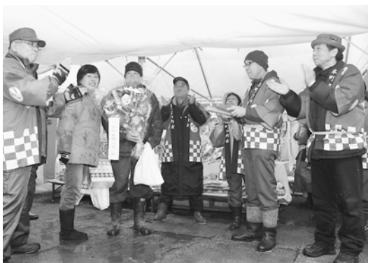
吉兆の売り場の前で拍手のサービス