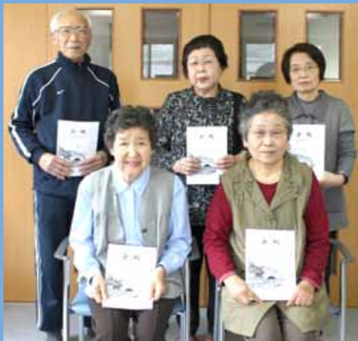
会報紙を手に笑顔のみなさん

東谷区全戸に配布されている東谷老人会の会報。約2か月に1号のペースで、編集グループのみなさんが発行しています。内容は地区の方から投稿された記事や行事の写真、俳句・短歌の文芸コーナーなど。また、新成人や赤ちゃんの紹介をするなど地域密着の話題が好評を得ています。