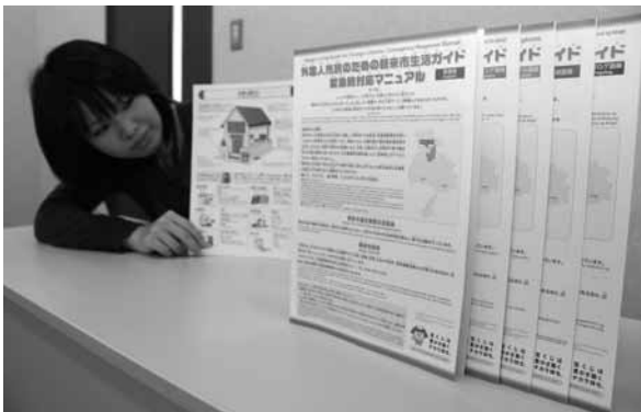
A4サイズで10ページ。5000部が作成されました。

中国語、ポルトガル語、タガログ語（フィリピン）の公用語、インドネシア語、英語で作られた冊子には、市役所窓口の案内や、緊急時に必要な簡単な日本語、防災に関する情報などを記載。各支所の交流協会窓口を設置するほか、外国人雇用企業などへ配布する予定です。