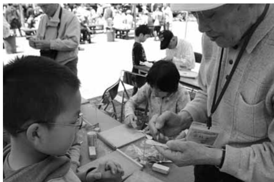
竹とんぼづくりに挑戦!

チャレンジ工房コーナーには、ひょうたん細工やねんど細工、竹とんぼづくり、石けんをカッターナイフなどで削り、形を整えるソーブカービングが子どもたちは、指導者に聞いたり、保護者に手伝ってもらったりしながら一生懸命作品を作っていました。