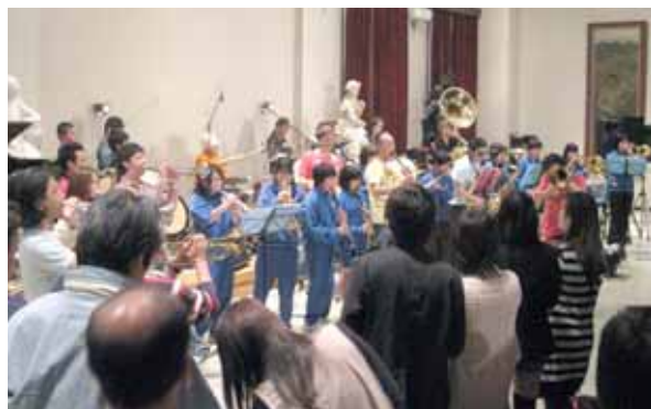
生野中プラスバンド部、地元ミュージシャン プロと共演 かなやライブ

生野町には、若い頃それなりに音楽に関わっていた音楽好きが集まって運営している、「かなやライブ」というライブ企画集団があります。リーダーのT氏の音頭とりで、「ホール・コンサートにはないライブ・ハウスの雰囲気味わってもらおう」と、スタッフ一同張り切っています。