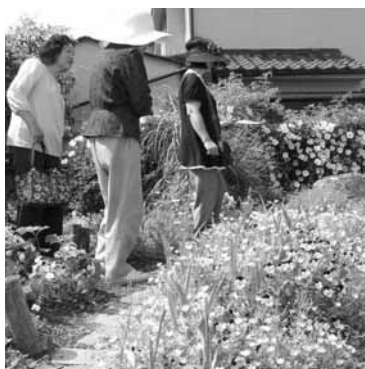
「きれい」と歓声が上がっていました

参加者は「かわいい花が上手に植えられていて、自宅のガーデンングの参考になります」と話していました。