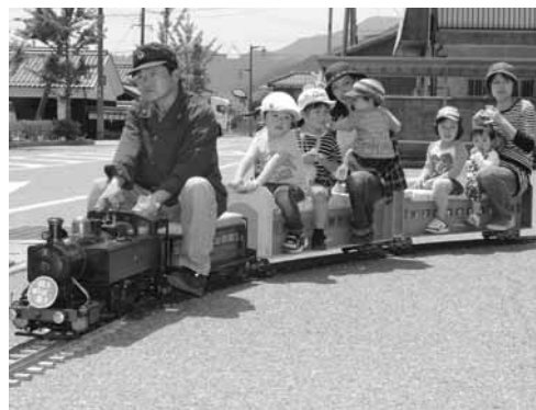
子どもに大人気のミニSL