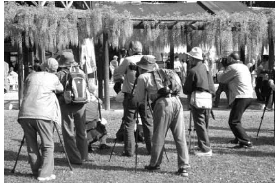
カメラを握る表情は真剣そのものでした

5月11日から20日まで、春の全国交通安全運動が実施され、朝来市でも啓発キャンペーンやパレードなど様々な取り組みが行われました。 5月19日、朝来警察署は和田山幼稚園で交通安全教室を開催。園児38人は、交通課の宮根係長から正しい道路の渡り方や歩道の歩き方を教えてもらった後、実際に道路で交通ルールを確認しました。園児たちは勉強したとおり、2列で歩道の右側をしつかりと歩いていました。