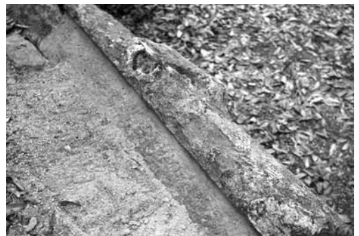
市内所在の長持形石棺(その1)

この長持形石棺というネーミングの由来となった「長持」とは、日本の民具である長持（主に近世に用いられたもので、衣類や寝具の収納に使用された長方形の木箱）に良く似ていることからその名前が付けられました。