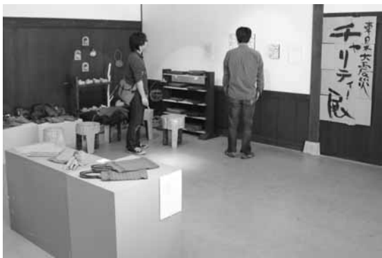
値札が付けられた作品が展示

同展のほか、作家が各自個展で作品を販売した売り上げの一部などもあわせ、購入した画材は、市主催の「全国こども絵画選抜展」等に応募している、被災地の小中学校に寄付されます。