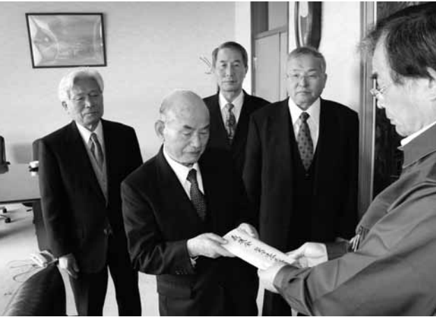
連合区長会から義援金を受け取る多次市長