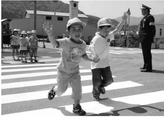
左右を確認してから上手に渡れていました

皆さんの周りの身近な出来事や話題をお知らせください。 市役所秘書課 ☎ 672-6116