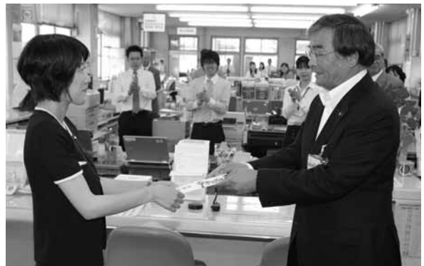
支給条件など詳しくは市民課にお問い合わせください