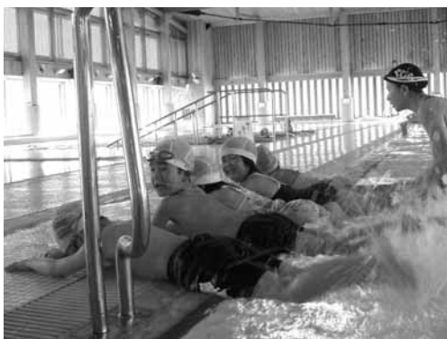
月会員と年会員の数が大幅に増えました

これまでの最高は、開設当初の平成17年度に記録した4万2375人でした。その後若干の減少や横ばいの状況でしたが、平成20年度に指定管理者制度(指定管理者:株シンコースポーツ)を導入し、徐々に利用者が増えました。