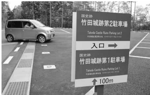
事業費約2,200万円をかけて整備された第2駐車場

また、利用者から改修の要望があつたJR竹田駅の男女兼用トイレについても、公衆用トイレとして整備しました。