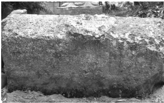
市内所在の長持形石棺(その2)

この石棺が納められた古墳は明らかではありませんが、但馬の中では最大の規模を持つ池田古墳(朝来市和田山町平野、全長約140m)の前方後