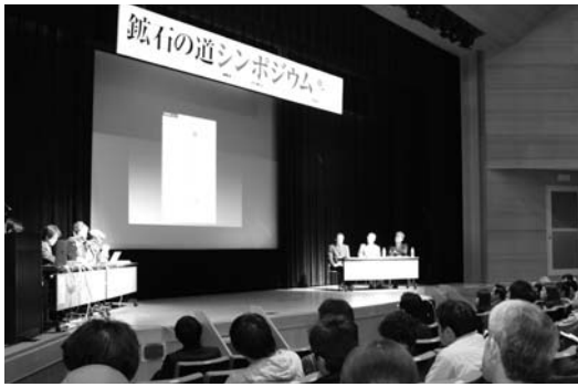
第2部は関係者によるパネルディスカッション。各地の取り組みや今後の方策など話し合われました。

生野、神子畑、明延の3鉱山の更なる利活用方法を検討する「鉱石の道シンポジウム」が12月4日、生野メインホールで開催されました。