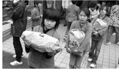
支援物資（じろはったん米）を被災地へ