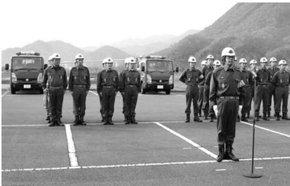
更新に伴う事業費は約 1,233 万円

式では、多次市長が「一日も早く操作方法を体得していただき、市民の生命と財産を守るため、消防活動におお一層ご尽力いただきたい」と呼びかけ、車両を受け取った両分団の団員は表情を引き締めていました。