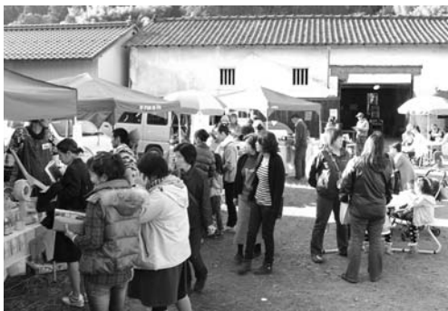
どこか懐かしい雰囲気が漂う会場に多くの人が訪れました

このイベントは、「人にも、自分にも、大地にもやさしい、おだやかな作り手によるマーケット」をテーマに行われたもので、県内外から多くの作家が集合。雑貨や食料品の販売のほか、紙芝居やコンサートなど様々なイベントが行われました。