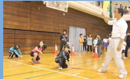
左:朝来市スポーツ推進委員 右:あさご市スポレク大会