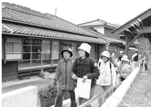
旧生野鉱山職員宿舎を出発する参加者

この事業は、歴史にふれながらウォーキングで体を動かせるのとあつて人気の行事。当日は生野小学校から生野銀山までを歩く往復約8kmの行程に市内外から約100人が参加。参加者は、生野書院や旧生野鉱山職員宿舎などを訪れ、スタッフの説明を聞きながら、地域の歴史や文化を学んでいました。