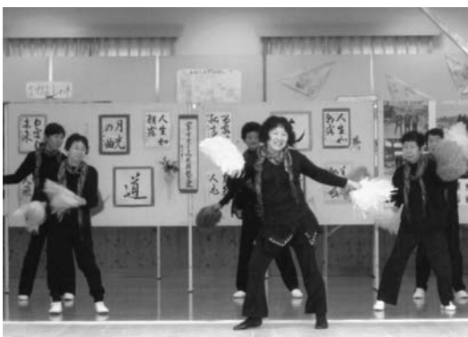
健康体操講座生によるリズム体操

同フェスティバルは、部落差別をはじめ、すべての差別をなくすための交流事業として、交流講座生と地域の皆さんの協力により、毎年行われています。今年も、人権をテーマにした作品展示、大正琴の演奏など講座の発表やおでんなどのバザー等盛りだくさんの内容で、楽しく集う交流の場となりました。