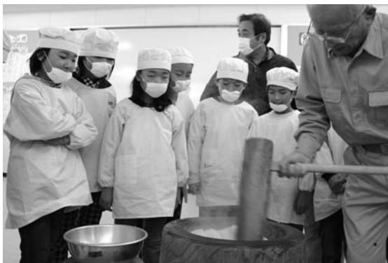
お餅を小突く作業を見守る児童

12月1日、生野小学校食堂で収穫祭が行われ、同小学校の3、5年生が餅つきを体験しました。円山区老人会の協力のもと、稲の植え付けから収穫作業、餅にして味わうことまで、一連の作業を通して、児童は作物を育てることの大変さや先人の知恵、無事収穫できることへの喜びと感謝を学びました。 できあがった餅は全校児童と隣りのこども園におすそ分け。つきたての餅が運ばれると大きな歓声が教室中に響き渡りました。