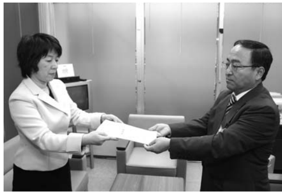
坂本委員長(左)から答申書を受ける垣尾教育長