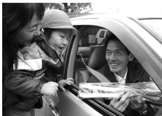
園児から笑顔で受け取るドライバー

1日、道の駅あさごで啓発チラシなどと一緒に配布されたのは市特産の岩津ねぎ。用意された250袋は、こぼと保育所の園児16人によってドライバーに手渡され、園児は「安全運転お願いします」と声を合わせて呼びかけていました。