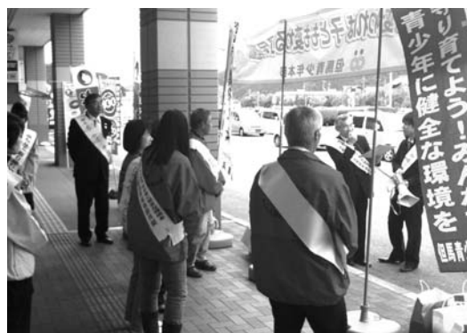
青少年の健全育成についてPRしました

当日は、多次市長をはじめ社会教育委員など関係機関10団体から総勢19名が参加し、約300人の市民など買い物に訪れた人たちに、啓発チラシや啓発グッズを配布し運動の主旨を訴えました。