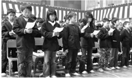
梁瀬小学校開校式

平成23年は皆さんにとってどのような一年だったでしょうか。昨年一年間に市内で起きた出来事や行事などを紹介します。