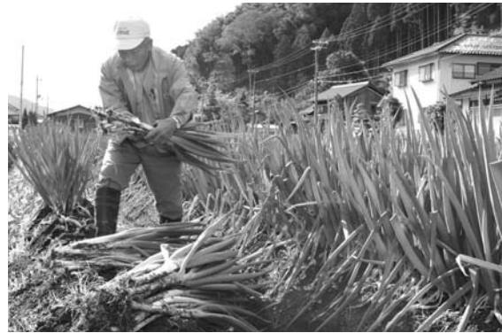
寒さが厳しくなるほどより甘味が増します

また、12月10日と11日に埼玉県深谷市で行われた「全国ねぎサミット」に初めて参加し、そのおいしさを全国に発信しました。