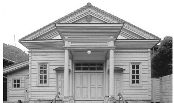
旧生野警察署正面外観

生野は400年以上にわたる採掘や製錬、加工、運輸といった鉱業を中心として栄えてきました。中世から近世においてはその時代における重要な経済基盤となった日本最大級の規模をほこる鉱山でした。そしてこの経済基盤を管理する代官所や番所といった統治・行政機能を核として、商業や流通といった消費的機能労働者をはじめとする居住機能が広がっていました。