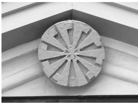
正面に飾られた旧生野町章

会館）に、大きな建物を新築して移転しました。そして元の警察署はしばらく私立の幼稚園として使われていましたが、小学校の敷地内に町立の幼稚園ができたことから、大正4年からは一区の公民館として利用され今に至っているのです。