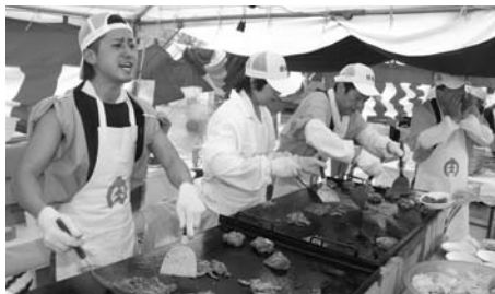
但馬・食文化まつり