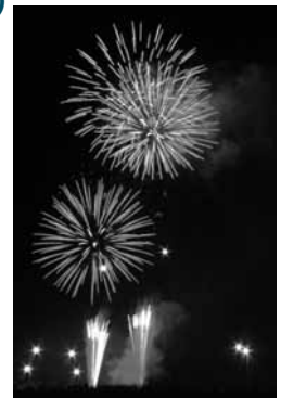
昨年の花火の様子