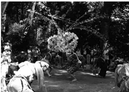
400年以上続く伝統の太鼓踊り

7月18日、県の無形民俗文化財に指定されている寺内ざんざか踊りが行われ、今年も五穀豊穡、子孫繁栄を願う舞が奉納されました。