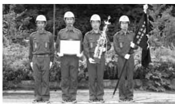
優勝 和田山支団第10分団