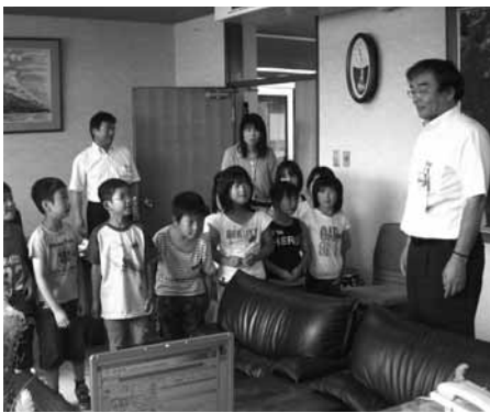
市長室で多次市長にあいさつをする児童

枚田小学校の2年生がまち探検に出かけ、うち16人が6月29日、市役所を訪問しました。