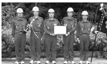
準優勝 和田山支団第1分団