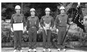
第3位 和田山支団第2分団