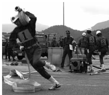
小型ポンプ操法の様子

この大会は、市合併後第2回目となり、ポンプ自動車の部に17チーム、小型ポンプの部に13チームが参加。出場した選手は日ごろの訓練の成果を披露しました。大会結果は左のとおりです。