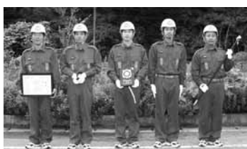
第3位 和田山支団第5分団