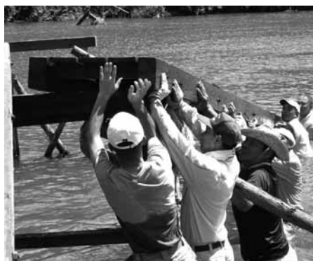
橋架けの実演をする高田区民