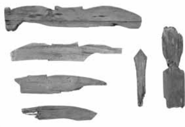
【写真②】釣坂遺跡の木製祭祀具(左:馬形、中:斎串、右:人形)

このような水辺のマツリは、当時の国や地方の行政機関の周辺で行われていたことがわかっていきます。但馬では豊岡市日高町の但馬国府跡周辺で確認されていますし、朝来市では立脇区の釣坂遺跡や山東町柴遺跡などでこのようなマツリが行われていたことを裏付ける木製祭祀具が出土しています【写真②】。釣坂遺跡からはこの人形とともに「郷長」と墨書きした土器が出土していることから奈良時代に設定された最も小さな行政単位で