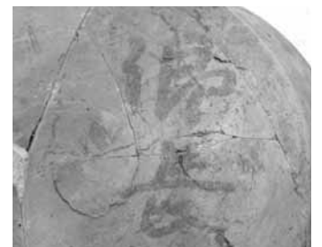
【写真③】「郷長」と墨書きした土器(付近に郷の役所があったことが想像できます)

ある「郷」の役所周辺において行われていたことが推定されます【写真③】。釣坂遺跡は当時、「桑市郷」と呼ばれた行政単位の中にありました。また柴遺跡では同時に出土した木簡から粟鹿の駅家(うまや)と推定される遺跡です。要するにこのような水辺のマツリは国を中心とした行政機関の事業のひとつとしてとり行われていたのです。