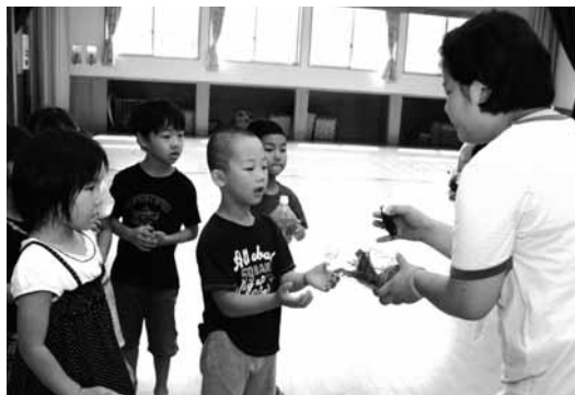
カブトムシを受け取る園児たち