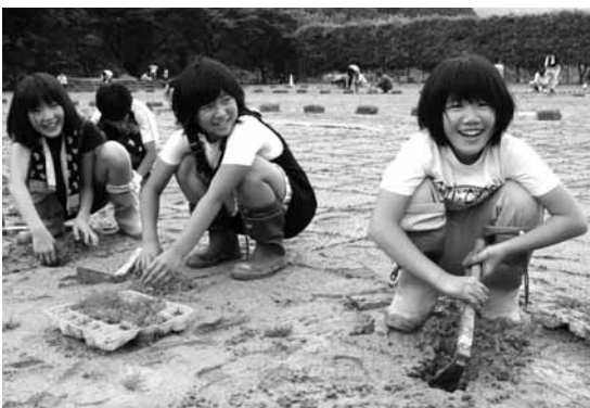
運動場に芝生を植える作業をする糸井小学校児童