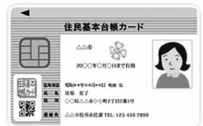
住基カード（顔写真付き）