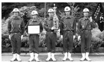
優勝 生野支団第1分団