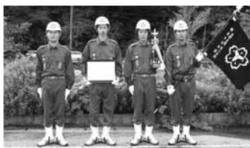
準優勝 生野支団第2分団