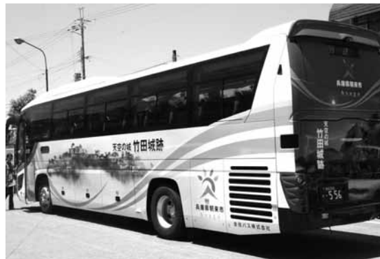
市の観光名所を飾った高速バス

車体左側に雲海の竹田城跡、右側に生野銀山坑道内と入り口後面に竹田城跡の石垣がラッピングされ、平成27年6月までの5年間運行します。