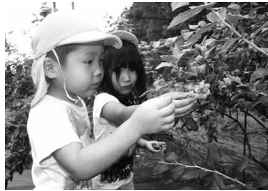
丁寧にブルーベリーを摘み採る園児たち