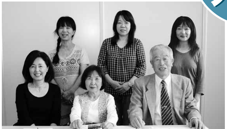
ひよっこ編集部の皆さん

市社会福祉協議会の地域かわら版作成講座の受講生6人が集まり、平成20年度に発足した「ひよっこ編集部」。地域密着型の情報誌「ひよっこ編集部だより」を発行し好評を得ています。朝来市の隠れた名所、産物、グルメなど色々な情報を紹介。1回約100部を発行し、公共施設などに配布しています。