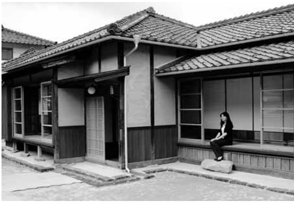
旧生野鉦山職員宿舎(甲7号)