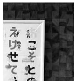
あさご森の図書館の壁面。 木の年輪を薄く切り、張り合わせています

図書館ではイベントも行っています。お話会や工作会、ときにはプロの人形劇団などの公演も開催します。また、市図書館から外に出で、保育所、幼稚園やこども園、宅老所への「出張読み聞かせ」な