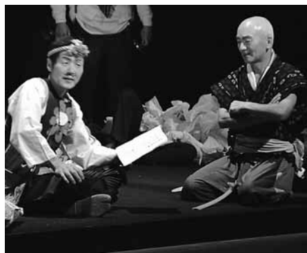
セミナー受講生の熱演

9月4日、和田山ジュピターホールで上演され、3時間に及ぶ大作に、集まった多くの観客