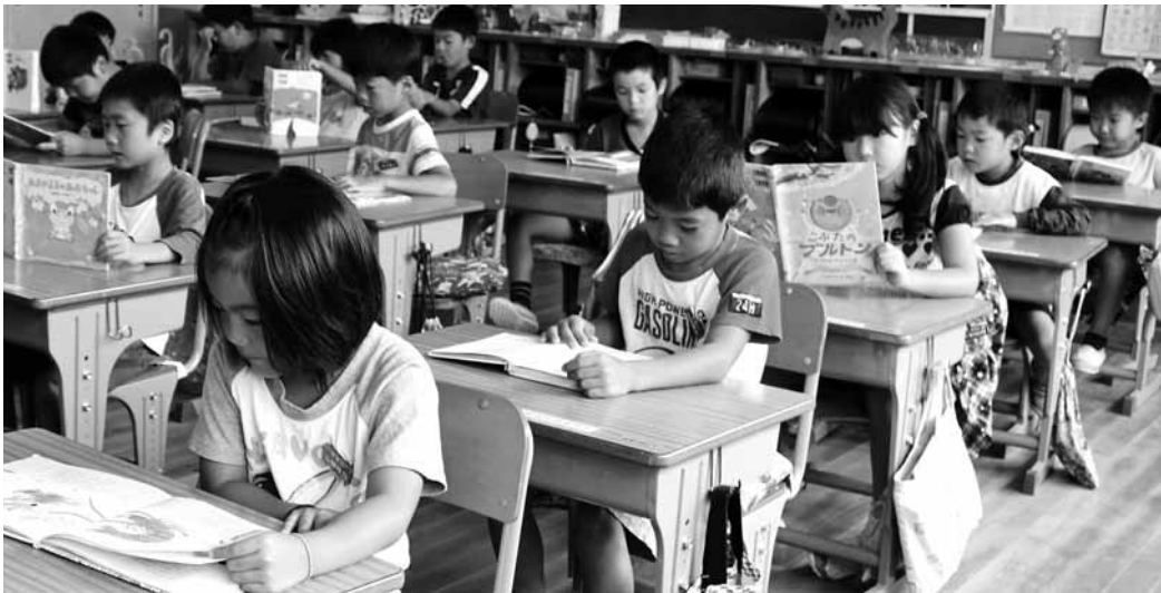
朝の読書タイム。静まりかえった教室には、本をめくる音だけが聞こえる