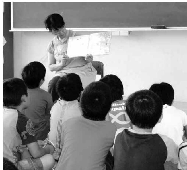
各学校では地域の読み聞かせサークルが活動されています

読 書は、生きる力をはぐくむ基礎となる思考力・判断力・表現力を育てるために欠かせない活動で、知識や技能を活用するための「言語活動」を充実させるための重要な取り組みです。学校・家庭・地域がそれぞれの役割を果たしながら、互いに連携して、いろいろな場面で子どもが読書に親しむ環境づくりを一層推進できるように、学校や市図書館が積極的にネットワーク作りを取り組んでいます。