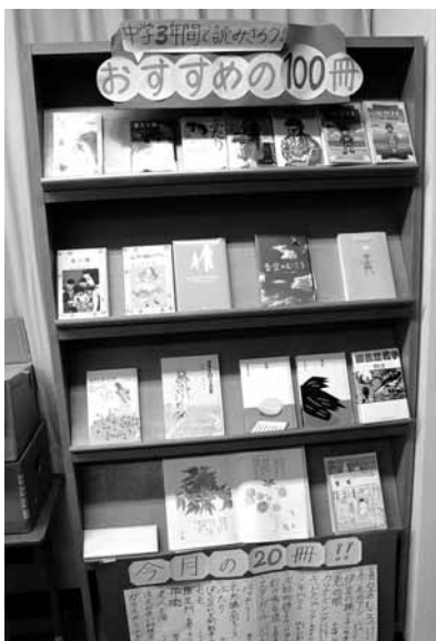
生野中学校の図書室では生徒自らが選定したおすすめの本を紹介