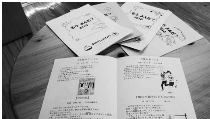
市内の子どもたちに配布されている読書案内「もうよんだ?」。 図書館が作っていることを知っていましたか?

どの活動もしています。また、テーマを決めてそれに関連した図書を紹介をする「ブックトーク」も小・中学校で行っています。