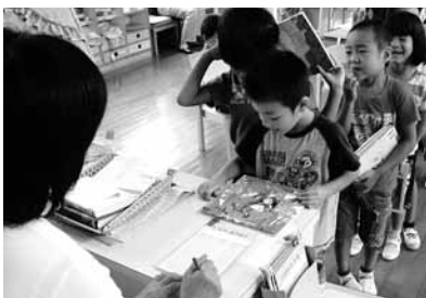
今日はこの本を読んでもらう。お気に入りの絵本を借りる園児

読 書は、生きる力をはぐくむ基礎となる思考力・判断力・表現力を育てるために欠かせない活動で、知識や技能を活用するための「言語活動」を充実させるための重要な取り組みです。学校・家庭・地域がそれぞれの役割を果たしながら、互いに連携して、いろいろな場面で子どもが読書に親しむ環境づくりを一層推進できるように、学校や市図書館が積極的にネットワーク作りを取り組んでいます。