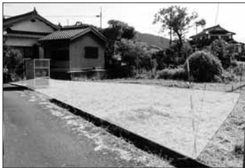
売却する市有地(澤区内)

▽申込受付期間 10月5日(火)～19日(火) 8時30分～17時15分(土日・祝日を除く)