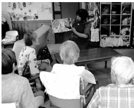
市図書館から宅老所「ふらっと」へ出張して読み聞かせ。 利用者のみなさんの楽しみの一つです

そんな時は市図書館から配布している読書案内「もうよんだ？」を参考にしてください。0歳から中学生まで、それぞれの年齢に合った本を職員が選び、コメントをつけて紹介しています。年4回発行で各学校などで配布しています。図書館にも置いてありますので活用ください。