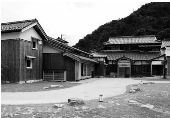
口銀谷鉦山町ミュージアムセンター