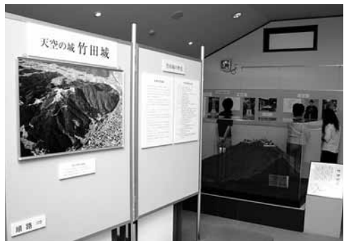
山城の郷の2階にオープンした歴史資料展示コーナー。開館は9時～15時で水曜定休日