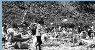
円山川下流域 豊岡市田結(たい)地区での漂着物清掃作業の様子

ごみの不法投棄は、わたしたちの円山川だけでなく、わたしたちの心も荒廃させてしまいます。家庭ごみやびん・缶・ペットボトルなどのポイ捨て、また大型ごみの不法投棄により環境が悪化し、ごみ回収に多大な労力と費用がかかっています。