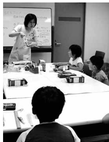
子どもたちに大人気の工作会

どの活動もしています。また、テーマを決めてそれに関連した図書を紹介をする「ブックトーク」も小・中学校で行っています。