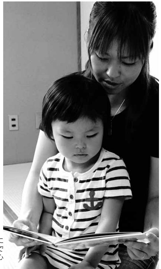
お気に入りの本をひざの上で読んでもらう瞬間

絵 本の読み聞かせは、親子が楽しく、自然に心の奥底からふれあう時間を作ってくれるものです。そして、そういう時間の積み重ねが子どもの心を豊かに育て、親子の絆を深めてくれるのです。親子の絆がしっかりと結ばれていれば、その心を見失ってしまふことはありません。成長をしつかり見守り、つまずきかけた時には、すぐに手をさしのべてあげることが出来ます。親と子が身を寄