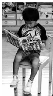
真剣に読書をする園児。自分の世界に入っています

また、地域の人々の支援による「ブック・ママ」、「お話レストラン」、「読みっこタイム」、「ちあふるぼつけ」などと銘打った読み聞かせ活動を各学校で繰り返し行っています。さらに、家庭での読書を推進するために「ノーテレビ・ノーゲームデー」を設けて、家族みんなで読書に取り組んでいる学校もあります。さらに、市図書館から