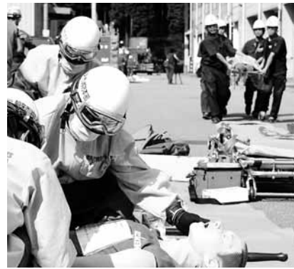
各参加機関が連携し負傷者の搬送