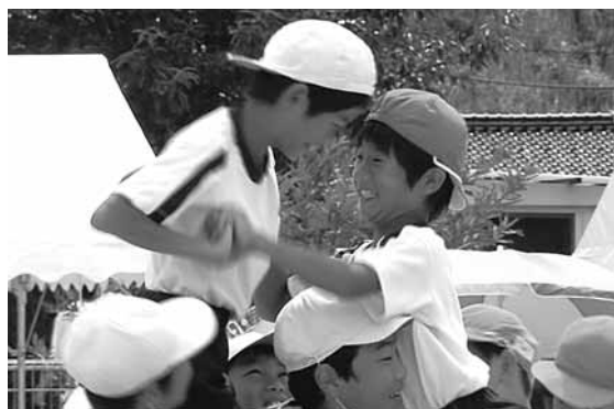
力いっぱい演技に取り組む子どもたち

また、大会進行の放送や競技の準備、後片付けを児童生徒自らが行う学校もあり、自分の役割を終えた子どもたちの顔には達成感があふれていました。