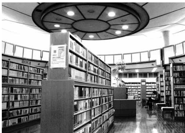
「知の宝庫」図書館。 棚には知識がピッシリ詰まっています

と上手につき合う方法の一つに「図書館」があります。図書館は本を借りるだけの所ではありません。別名「知の宝庫」と言われるだけあって、さまざまな資料をそろえています。「おいしい野菜の作り方」のように身近な疑問から「地球温暖化を防止す