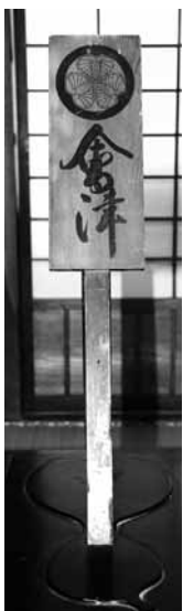
葵の御紋が記された荷物札