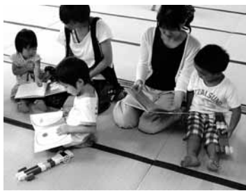
親子で読書。楽しい時間

昔 は、親から子どもへの優しい語りかけが絶えずなされが少なくなり、テレビやビデオの音声はその代わりを果たそうとしています。確かにテレビやビデオを見せておけば、子どもは喜び静かにしているかもしれませんが、しかし、そのような機械的音声は決して子どもの言葉に反応したり心をはぐくんではくれません。赤ちゃんは、優しい子守歌に安心して眠りにつきます。もちろん歌詞の意味をわかっている訳ではありませんが、自分にとって、