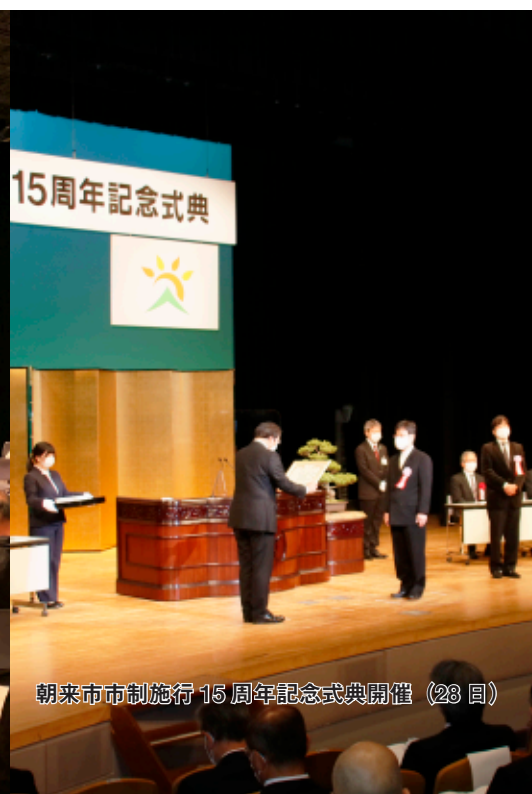
朝来市市制施行15周年記念式典開催（28日）