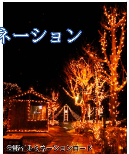
宝野イルミネーションロード