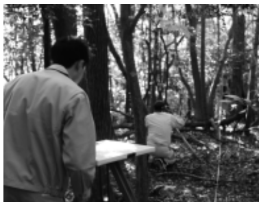
西山1号墳での測量調査の様子

も、6世紀後半以降の古墳では、金銅装大刀や馬具といったきらびやかな金属製品も多数出土しています。宮内中山6号墳(宮内区)、春日古墳(林垣区)、春の木田古墳(久田和区)など、全長10m前後の古墳から出土した金銅装製品は、王以外にも現在の小学校区規模の地域を治めた有力者の存在を示唆しています。朝来市では1400を超える古墳とそれに伴う大型集落跡が