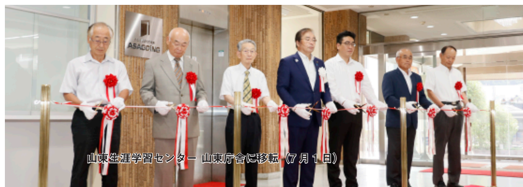
山東生涯学習センター 山東庁舎に移転(7 月 1 日)