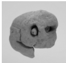
牛形埴輪の一部分