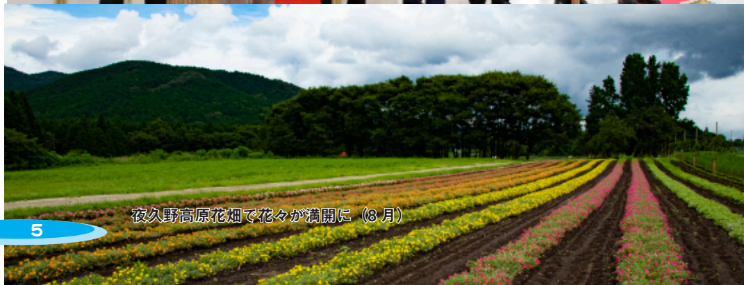
夜久野高原花畑で花々が満開に(8 月)