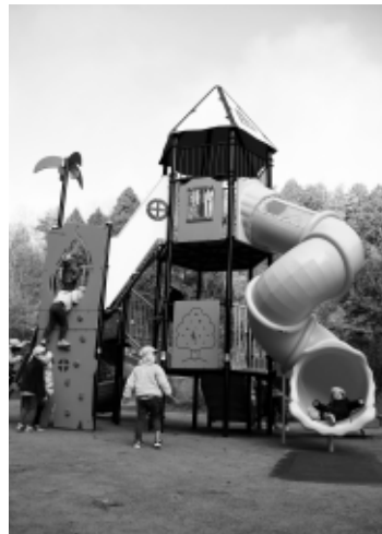
新たに設置された複合遊具で元気よく遊ぶ園児ら

式には、やなせこども園とあわが保育園の園児49人が参加し、園児による風船飛ばしが