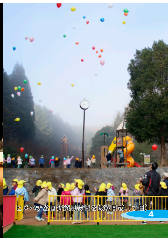
ヒメハナ公園新遊具設置お披露目式（7日）