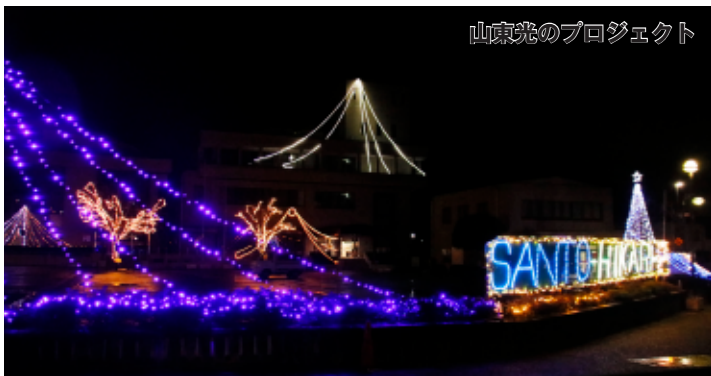
山東光のプロジェクト