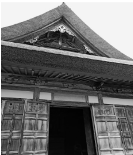
改修工事が完了した大明寺の開山堂