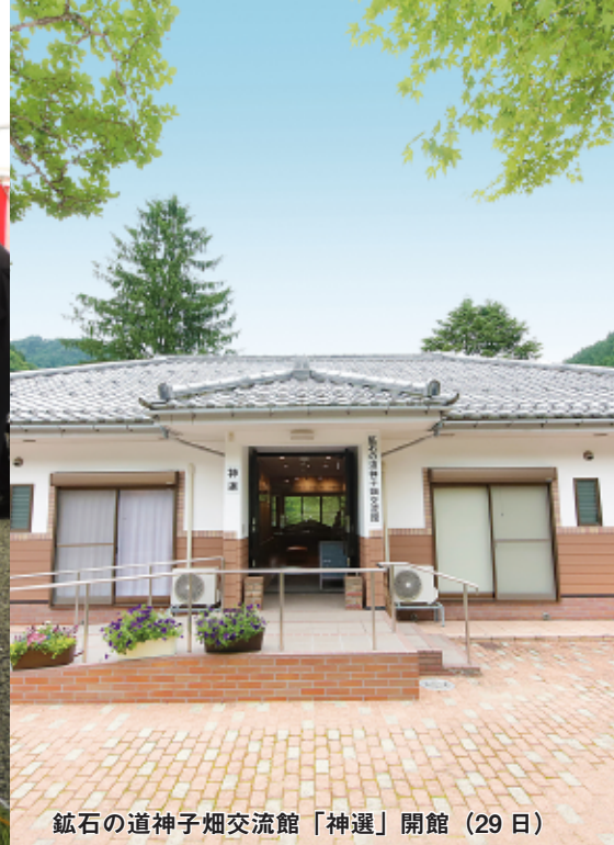
鉾石の道神子畑交流館「神選」開館（29日）