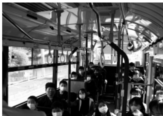
路線バス車両に乗車した梁瀬小5年生の皆さん

これは、バスを利用する際の交通ルールや乗車時のマナー、バス産業の現状などについて学ぶことを目的に、全但バス(株)と市が協同で開催。当日、同社の社員からバスの現状やバス利用時の注意点についての説明のあと、実際に路線バスに乗車し、整理券の取り方や運賃の支払い方法について説明がありました。またバス教室中には、児童たちから車いすの人の乗車方法や