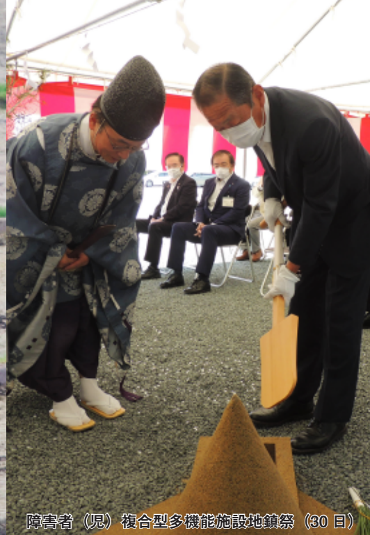
障害者（児）複合型多機能施設地鎮祭（30日）