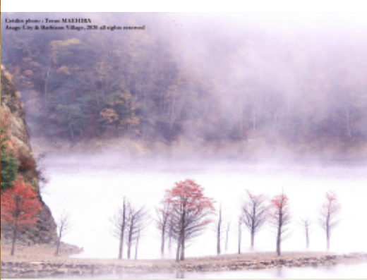
「朝来・パルピゾン交流写真コンテスト作品展」開催(3 日～28 日) 上・大賞(朝来)「霧の黒川湖」下・大賞(パルピゾン)「昔の光」