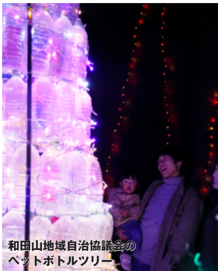
和田山地域自治協議会の ペットボトルツリー