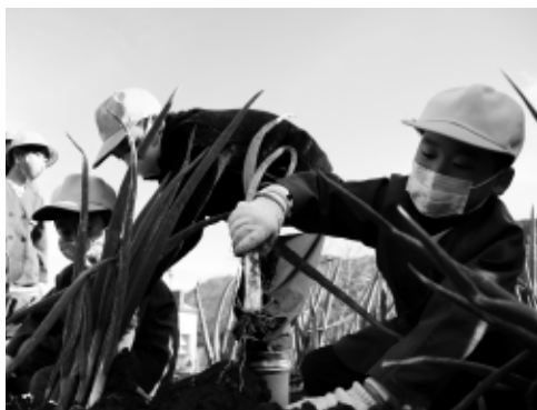
折れないように気をつけて