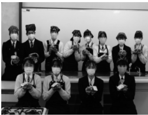
ケーキを作製した和田山高校の皆さん

17日(木)、和田山町内のひとり暮らしの高齢者の皆さん318人へケーキのプレゼントを行いました。