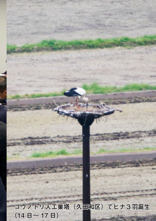
コウノトリ人工巣塔（久田和区）でヒナ3羽誕生（14日～17日）