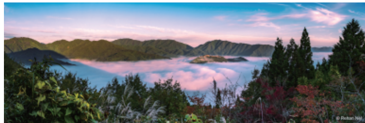
左・いくの地域自治協議会での活動の様子 右・レハンの愛車 上・制作中のオオサンショウウオのお土産 下・レハンが撮影した竹田城跡の雲海

私が生野で興味を持っている重要な資産は、その建築景観です。自治協議会では、空き家を活用するために「空き家調査」に取り組みしており、今後の活用方法を模索しています。現在、空き家をゲストハウスやコワーキングスペースなどに転換できないかと検討中です。