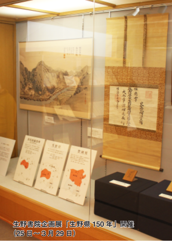
生野書院企画展「生野県 150 年」開催 (25 日～3 月 29 日)