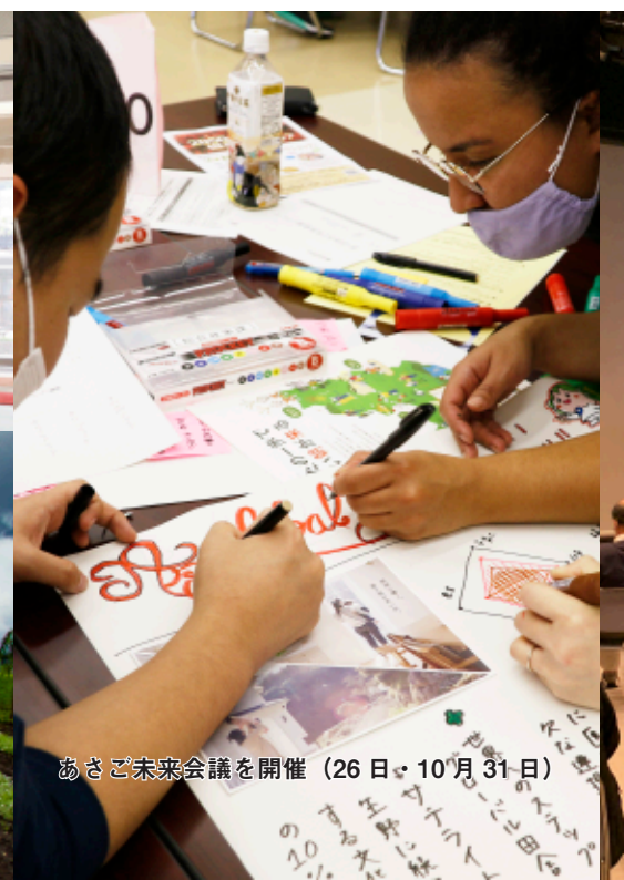
あさご未来会議を開催(26 日・10 月 31 日)