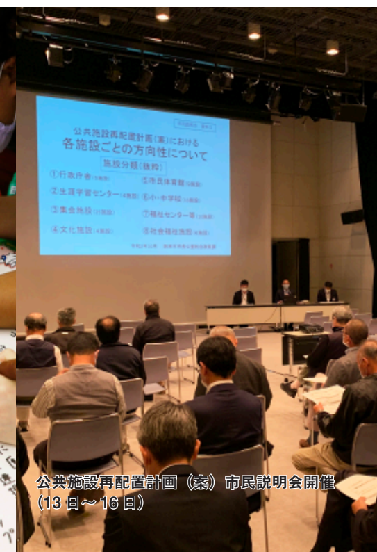
公共施設再配置計画（案）市民説明会開催（13日～16日）