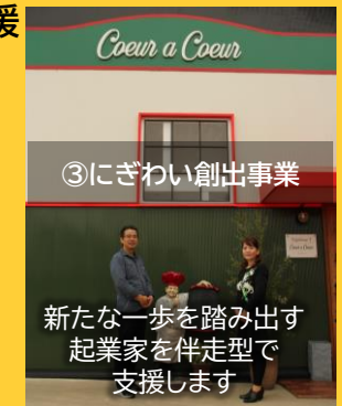
③にぎわい創出事業