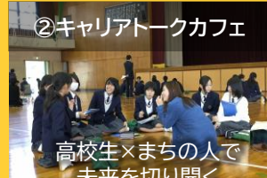
②キャリアトークカフェ