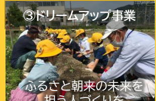
③ドリームアップ事業