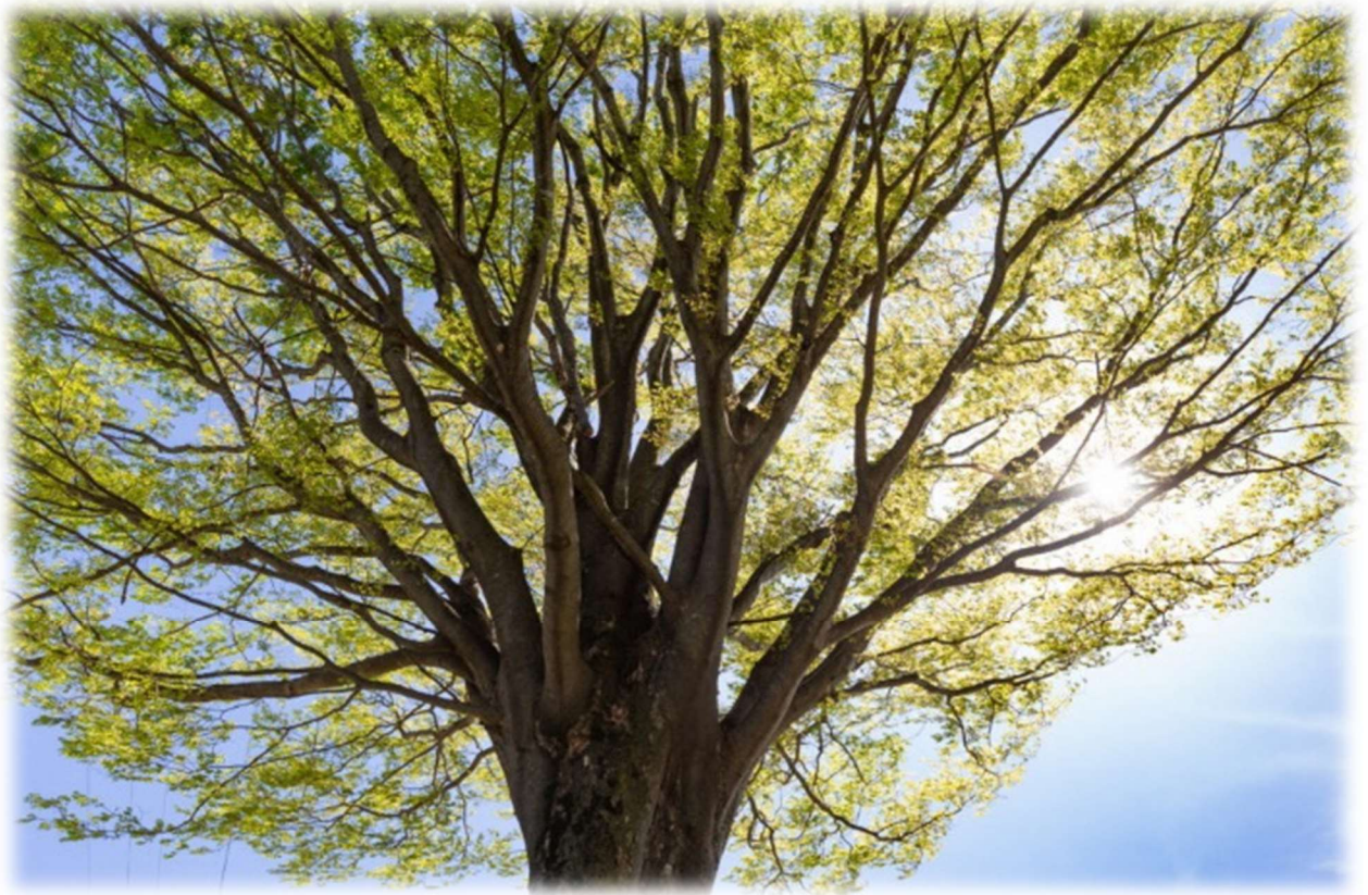
朝来市の木 けやき