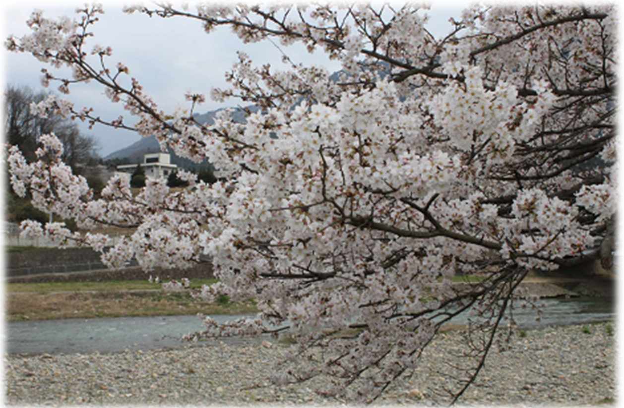
朝来市の花 さくら