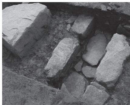
礎石と排水溝(二の丸)

能を果たしていたのです。朝来市では、本年の11月に「第30回全国山城サミット朝来大会」を開催します。通常は非公開としているエリアの井戸曲輪を、サミット期間に限定で一般に公開します。この機会にぜひ竹田城跡にお越しください。