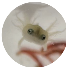
見上げるトウキョウサンショウウオの幼生

今、ハンザキ研究所にはオオサンショウウオだけでなく、このトウキョウサンショウウオの幼生が1000匹ほどと、大人が2匹います。幼生は小さくてかわいい（2センチほど！）ので、ハンザキ研究所の開放日にぜひ見に行っちゃってください。