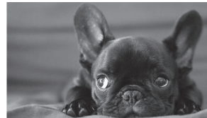
僕を外に寝させるの?(´・ω・´)

現在、新しいアパートを探していますが、将来的にフレンチブルドッグを飼いたいと思って、「ペット相談可」のところにこだわっています。そうすると、物件数がやはり少なくなりますね。日本では賃貸ならペットを飼うことが難しいです。あるところで「屋外なら可」と読んでびっくりしました。フランスで、イヌを外で飼うと言ったら、それはペットではなく牧羊犬や番犬など、役割を果たすイヌだと思えます。牧場のブタやウシと変わりありません。し