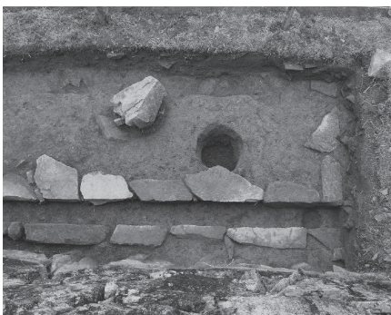
縦断排水溝(東の丸櫓門)

このように排水溝は現在では埋まってしまっていて、目にすることはできませんが、城が造られた頃にはさまざまなどころにあったことが想像できます。排水溝は雨水を処理し、石垣を適切な状態で維持するために欠かせない機