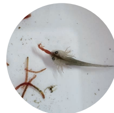
エサを食べるトウキョウサンショウウオの幼生

朝来市の旬な情報を、SNS やスマートフォンアプリで配信しています。下記 QR コードを読み取りアクセスしてください。