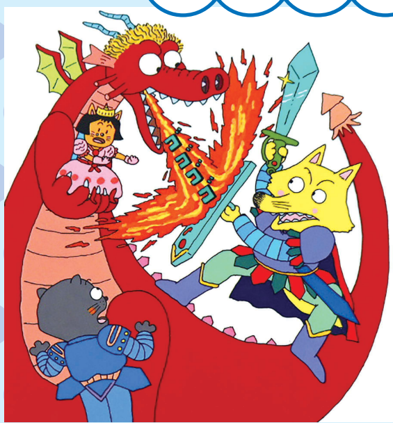
「かいけつゾロリのドラゴンたいじ」1巻(1987年)