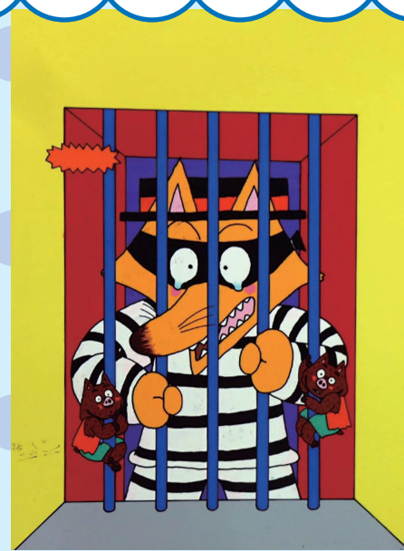
「かいけつゾロリつかまる!!」15巻(1994年)