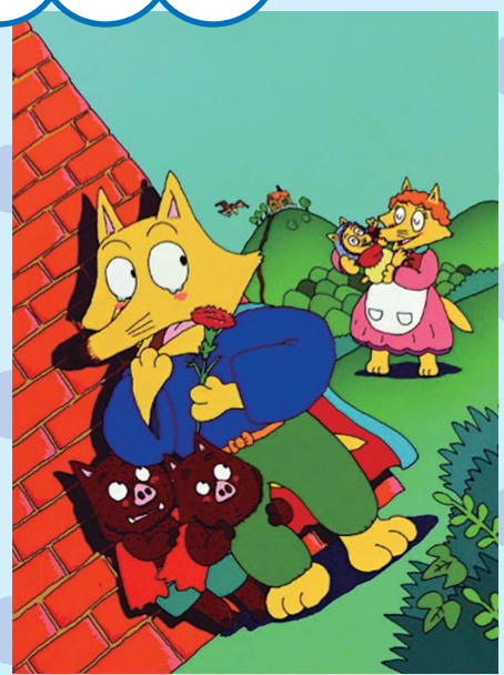
「かいけつゾロリのママだーいすき」9巻(1991年)

いたずらの王者をめざす、「かいけつゾロリ」シリーズの主人公「ゾロリ」は勇敢で仲間思いで、ちょっと涙もろい。そんなゾロリと仲間たちのわくわくドキドキの大冒険を描いた原画や資料など約200点を展示します。