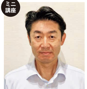
ミニ 講座 但馬長寿の郷 地域ケア課長 理学療法士