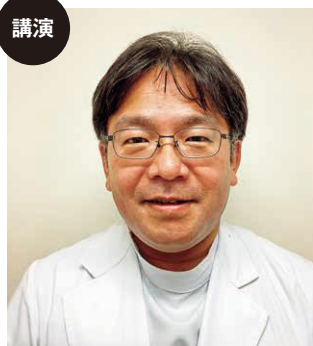
講演 公立八鹿病院 糖尿病・内分泌内科 医師

駐車場 ホール周辺 ※できるだけ乗り合わせてお越しください。 ※あさご森の図書館、ふれあいプールくじらへの駐車はご遠慮ください。