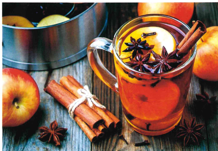
シナモンやオレンジでスパイスされたアップルスパイスティー