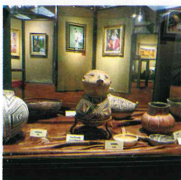
フレーベル博物館

私は朝来市にいることをとても嬉しく思っており、ここでまた1年間、学び成長することを楽しみにしています。