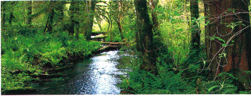
←バーロー・ウェイサイド パーク