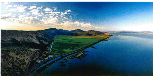
アッパークラマス湖