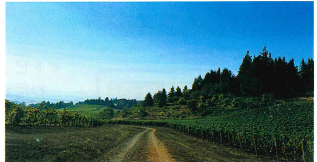
オレゴンワインの畑