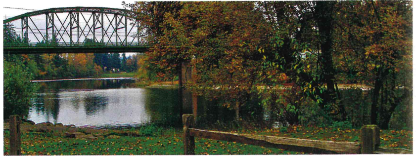
カーバー・パーク→