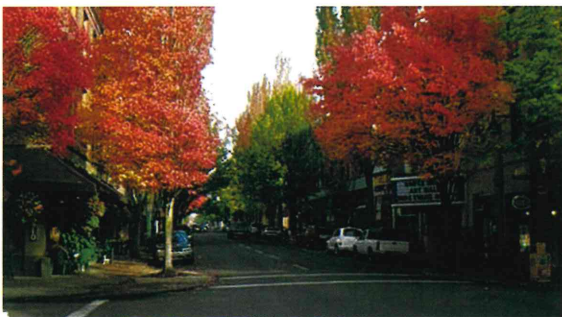
マクミンビル市 3丁目

朝来市でやさしくて魅力あるたくさんの人に出会いました。特に生徒と先生方です。朝来市に住んでいる間にもっとコミュニティの人に会ったり、日本の文化を習ったり、たくさん思い出を作ったりすることが楽しみです。