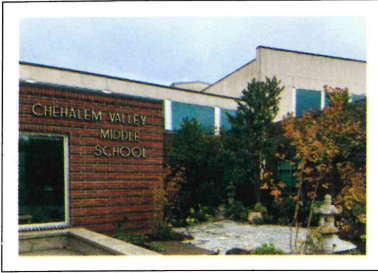
シャヘイラムバレー中学校 友好の庭がリニューアル！