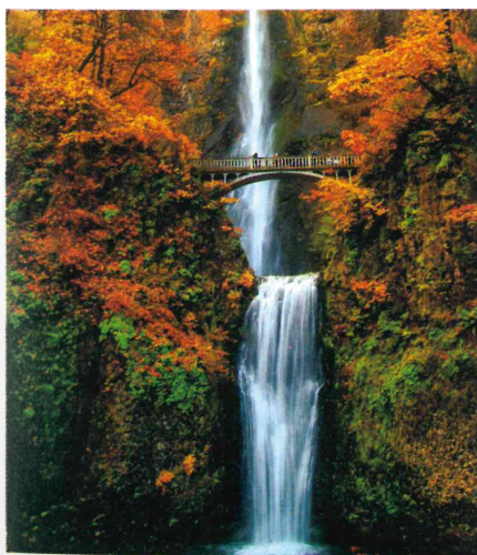
マルトノマ滝での紅葉

毎年この時期になると、グレシャム市では秋のお祝いの準備に入ります。ハロウィンもその中の一つで、11月にくるサンクスギビングデーと続いています。アメリカの秋の文化を皆さんに伝えようと思いながら、日本の秋の文化についても詳しく知りたいという気持ちになりました。