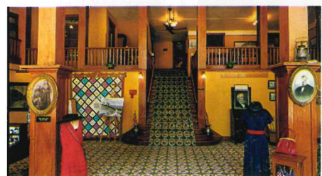
ボールドウィンホテル博物館