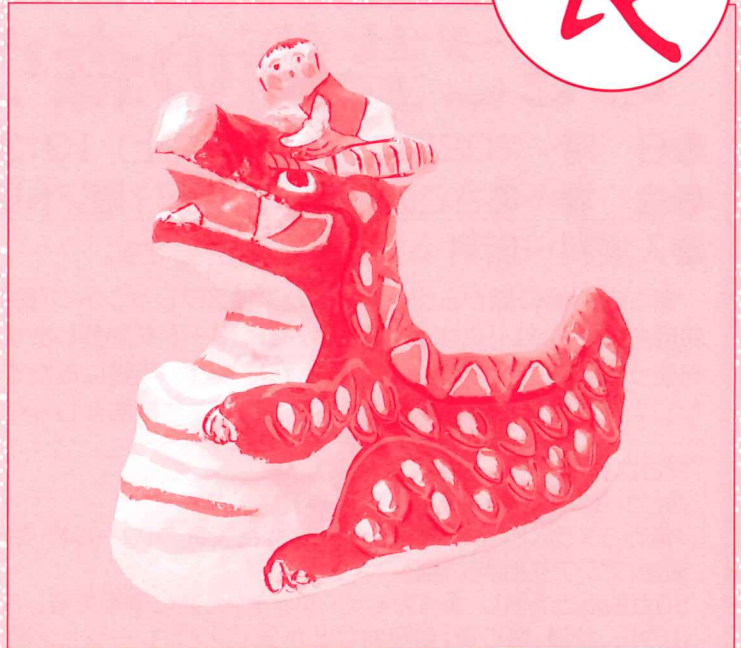
吉岡武徳「童子のり飛竜」